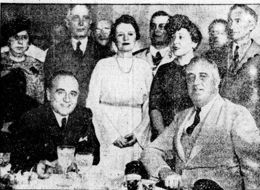
Két mosolygó elnök: Roosevelt és Vargas argentinai elnök (balról)