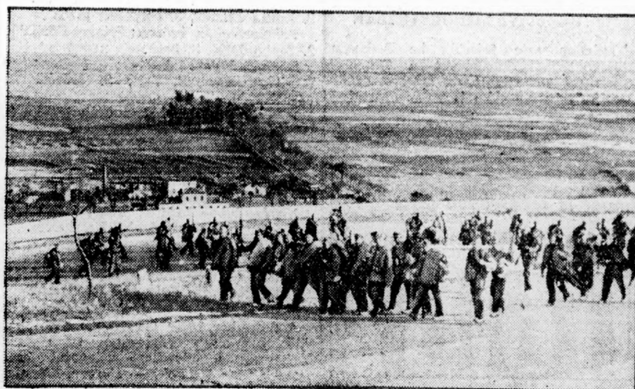
Vörös csapatok Sesena környékén visszatarthatnak a frontról