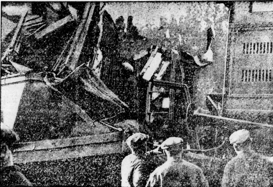
Borzalmas összeütközés történt Chaumont közelében: a Páris—belforti expressz belefutott a Páris—bázei vonatra, amely fékhiba miatt nyílt pályán megállt. Két halott és sok sebesült áldozata lett a katasztrófának.