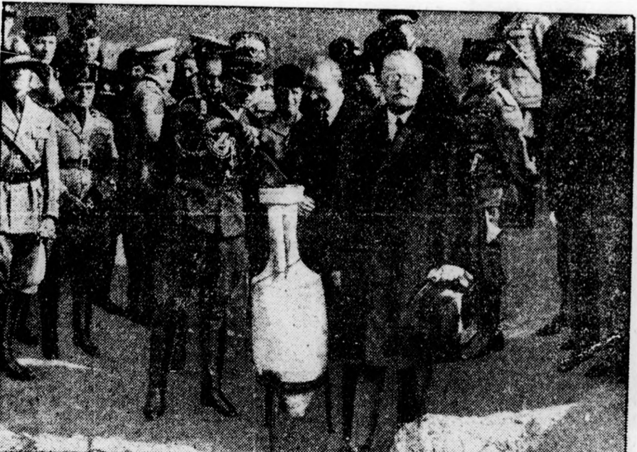
Pilsudski marsall készülő szobra számára római földet visznek olasz frontarcosok Varsóba. A római lengyel katonai attasé éppen földet tölt az urnába, mellette a lengyel követ.