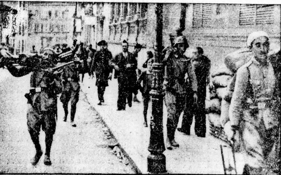
Az Ovidoba bevonuló marokkói csapatok. A kormányhadsereg 13 hétig, tehát húsz nappal tovább, mint Alcazar hőseit, ostromolta az Ovideot megszállva tartó nemzetieket, akik most végre felszabadultak.