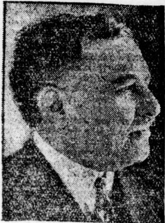
Leon Daudet a betiltott „Action Française” vezére.

A népi arcvonalban tömörült szervezetek nagyszabású tüntetést rendeztek Párizs utcáin. Délután két órára hívták össze a felvonuló csoportokat. A gyülekezés a Pantheon előtti téren történt, onnan a St. Javques úton, a Boulevard St. Germain-en, a Sully hídon, a Boule-