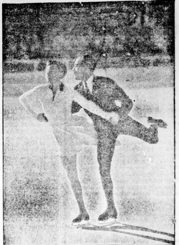
1. Garmisch-Partenkirchenben, a téli olimpián a katonai 25 kilométeres sí-járőverseny Olaszország csapata nyerte. Képünkön Fritsch német tábornok üdvözlő a győzteseket. 2. A sí-járőverseny győztesének emlékérméje. 3. Herber-Baier német műkorcsolyázó olimpiai bajnokpár.