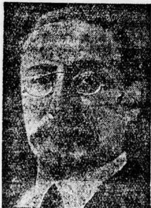
Leon Blum francia szocialistavezér,

és kommunisták között véres verekedés történt. Három ember megsebesült.