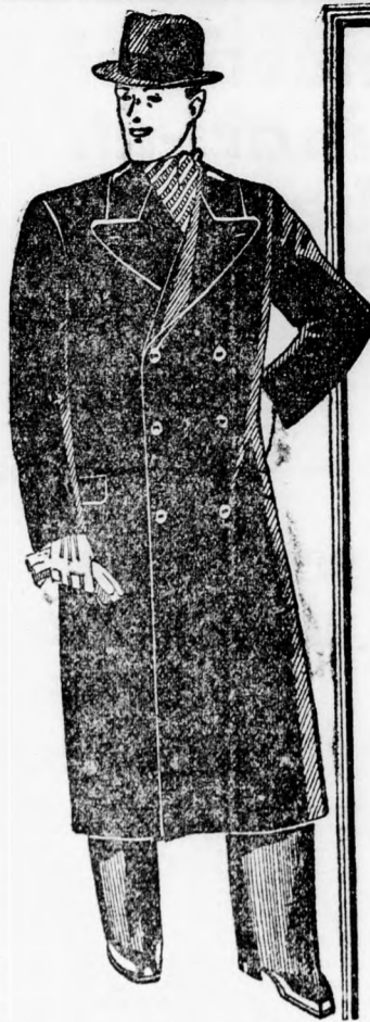
Postán utánvétellel díjmentesen