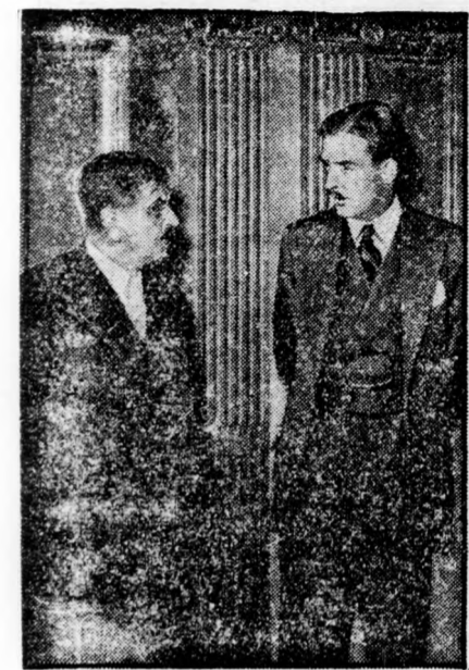
Laval és Edén tanácskozása Genfben az abesszin kérdésről.

Egy arrahaladó gépkocsi találta meg az elgázolt munkást, akit életveszélyes állapotban szállítottak a székesfehérvári kórházba. Az elmenekült gépkocsi vezetőjének kézrekerítésére nyomozás indult.