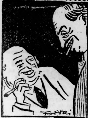
STUX ES FUX a csónakházban a 6. oldalon