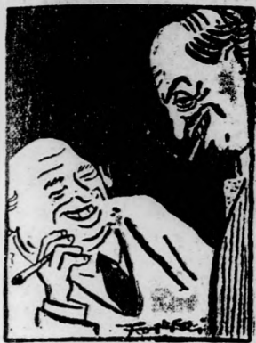
STUX ÉS FUX A MARGITSZIGETEN a 8. oldalon