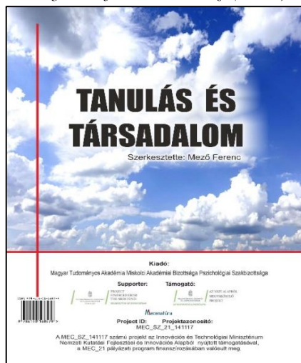
3. ábra: a „Tanulás és társadalom” című kiadvány borítója.

A konferencia programja, összefoglalója, a bemutatásra került prezentációk absztraktjai megtalálhatók a „Tanulás és Társadalom” konferencia, illetve az azt lehetővé tevő MEC_SZ_141117 projekt weboldalán (URL: https://uni-eszterhazy.hu/tanulas-konferencia ), továbbá a „Tanulás és társadalom” című e-kiadványban is (3. ábra, Mező, 2022c).