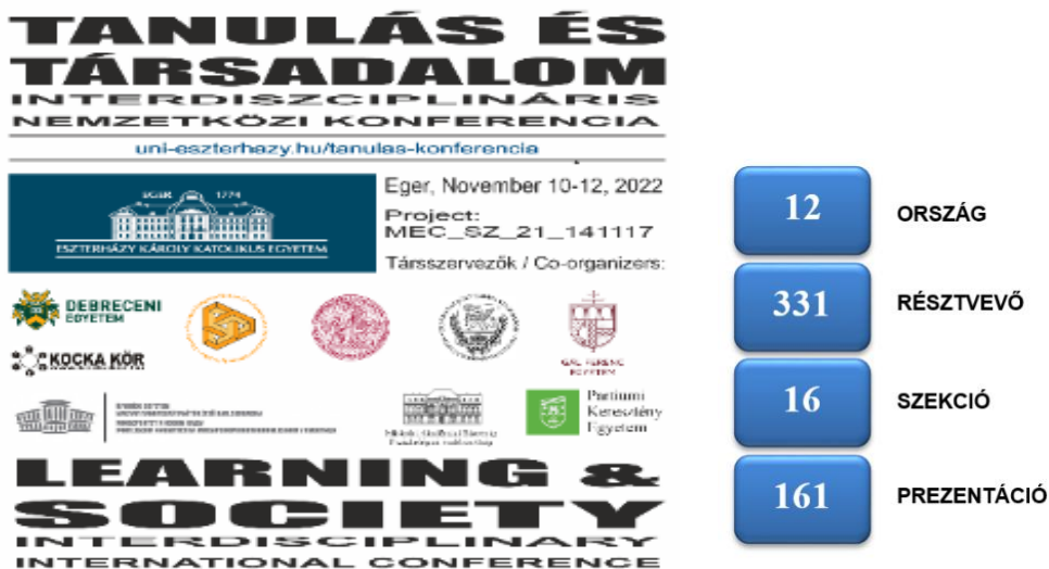
1. ábra: a „Tanulás és társadalom” konferencia számokban.

A „Tanulás és Társadalom” Interdiszciplináris Nemzetközi Konferencia megrendezésére 2022. november 10-12.-én került sor Egerben, az Eszterházy Károly Katolikus Egyetemen, valamint az online térben (1. ábra).