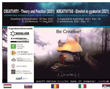
3. ábra: A CTP (2021) konferencia logója

A projektet bemutató prezentációk is közzétételre kerültek e két konferencián kívül a VI. International Interdisciplinary Conference (Debrecen, 2021. március 19.) és a VII. International Interdisciplinary Conference (Debrecen, 2022. március 18.) rendezvényeken (4. ábra).