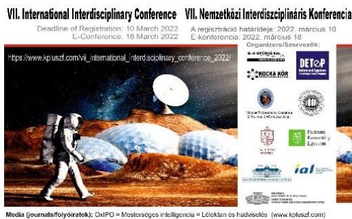
5. ábra: a workshopok logója