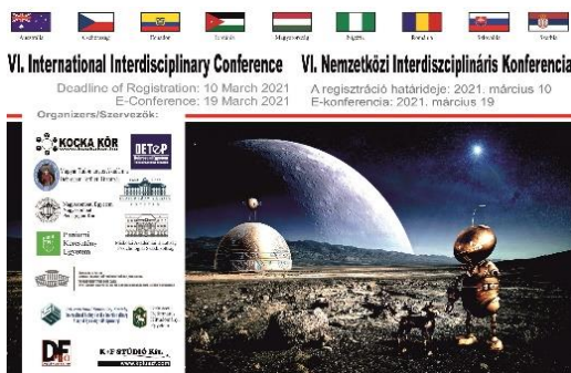
4. ábra: a VI. és a VII. IIC konferenciák logója

A tehetséges fiatalok és szüleik számára workshopok szervezése is része volt a projektnek: öt „Anya és lánya” workshop megrendezésére is sor került 2021-ben (5. ábra). A workshopokra való bejelentkezésre a programban résztvevők és szüleik mellett bárkinek lehetősége volt. Az „anya-lánya” jellegű workshopok során a családon belüli szemléletformálásra is figyelmet fordított a projekt. Főbb témakörök: