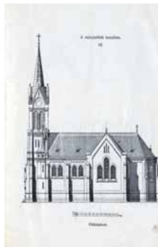
Mátyásföld katolikus templomának terve, Paulheim Ferenc építette