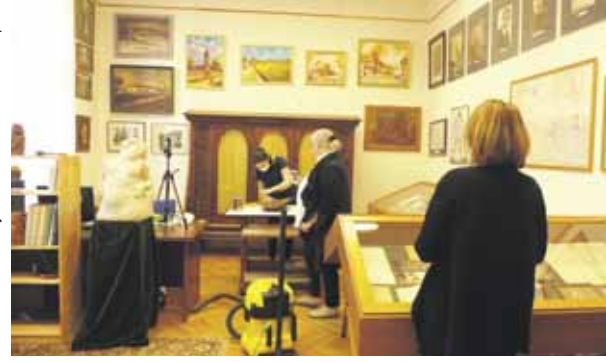
Koncz Vilmos fafaragó szobrának restaurálása a kutatóteremben