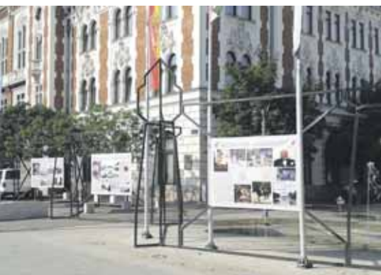
Hat tabló alkotta a szabadtéri tárlatot

Hármas jubileumra is felhívta a figyelmet az újpesti Városháza előtt felépített vasszerkezetre kihelyezett kiállítás – a Károlyi-családnak Újpest alapításától napjainkig betöltött szerepét bemutatva. A feketére festett mobil vas-