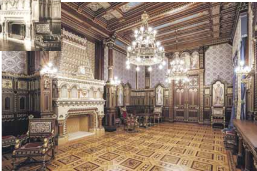
Felül a budavári Királyi Palota Szent István-terme 1903 előtti képeslapon, alul az újjáépített Szent István-terem

vári Királyi Palotába, annak egyik legjelentősebb belső terévé válva. Nem véletlenül, mivel belső berendezésén Thék Endre és sok más mellett Jungfer Gyula , Strobl Alajos , Zsolnay Vilmos is dolgozott.