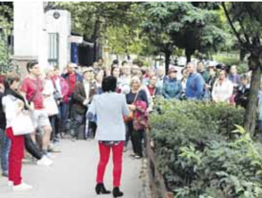
Szeccsessziós séta egy pillanata

Élményekben gazdag rendezvényt szervezett „Zsolnay – Épületkerámiák a Schiffer-villában” címmel a Pénzügyőr- és Adózástörténeti Múzeum (PAM) – a Kulturális Örökség Napjai al-