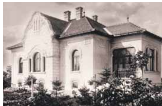
Villákat is tervezett és épített