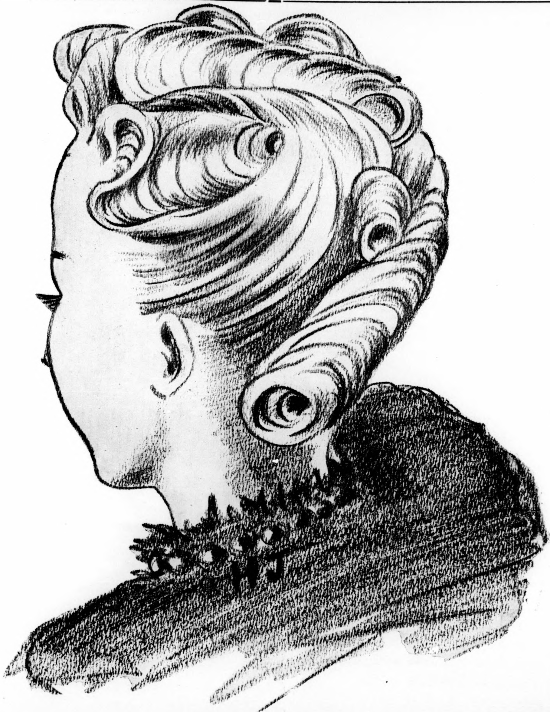
Nemzetközi és Országos Fodrászversenyen díjat nyert modern irány frizuraforma 1943. évre. Tartósan göndörített és vízzel hullámozott hajból.