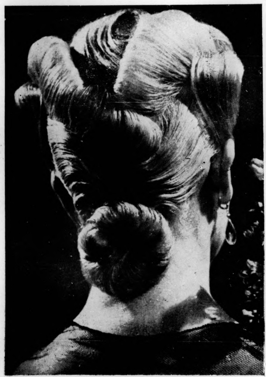
A Nemzetközi Fodrászversenyen