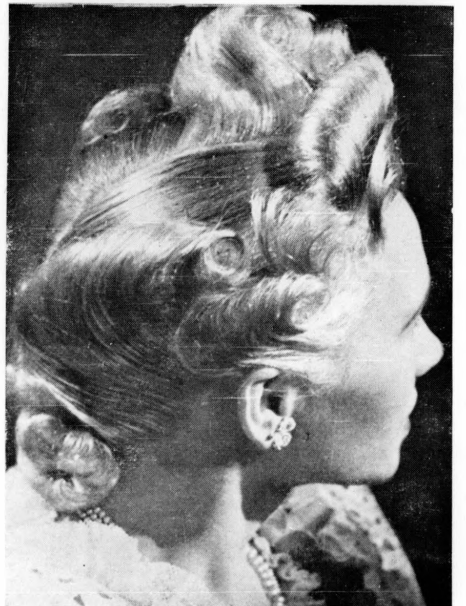
A Nemzetközi Fodrászversenyen díjat nyert vassal ondolált és paróka frizurák