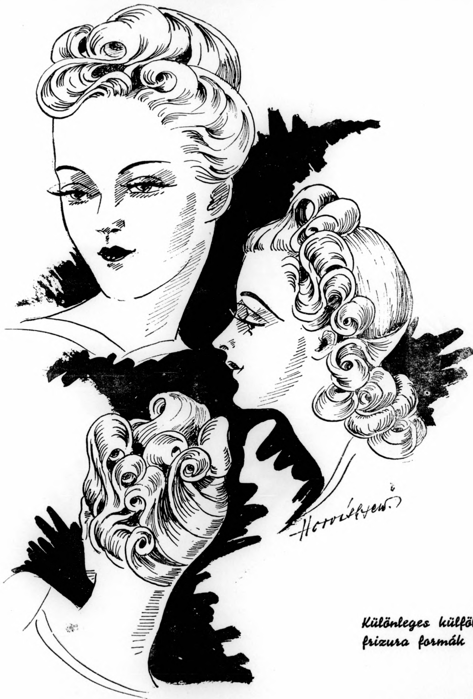
Különleges külföldi frizura formák