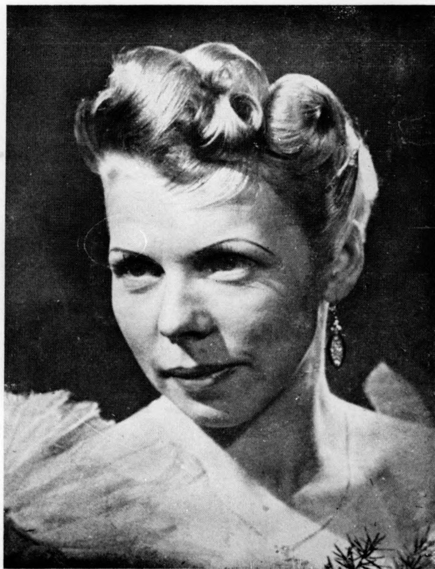
Nemzetközi Fodrászversenyen díjat nyert vassal ondolált és paróka frizurák