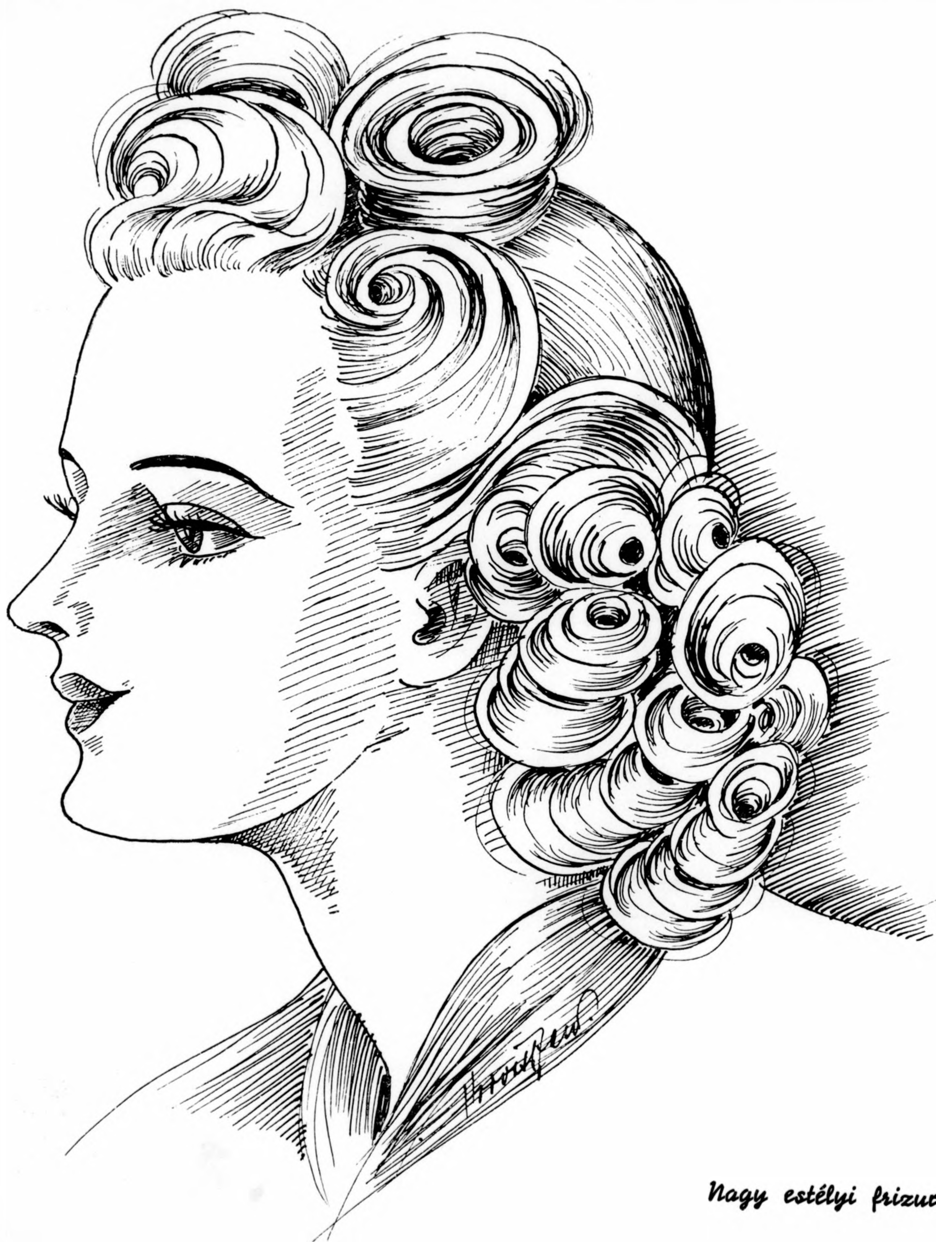
Nagy estélyi frizúra