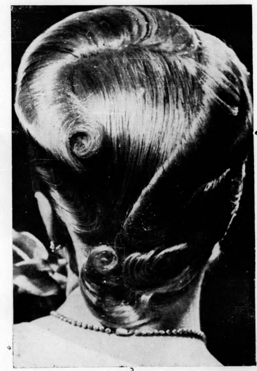
díjat nyert vassal ondulált és paróka frizurák