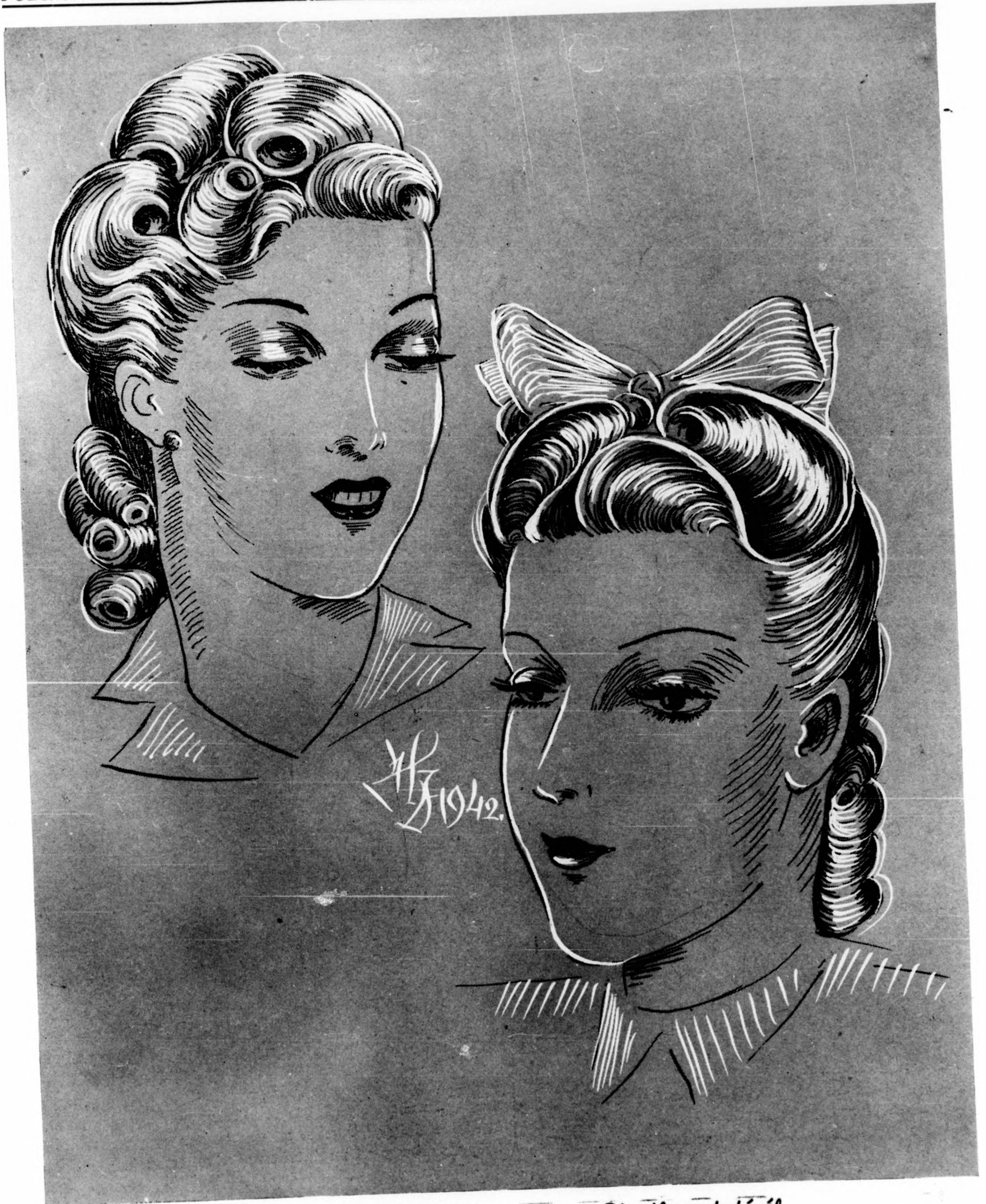
Modern strand-feizura a nagy Divatbemutatóról.