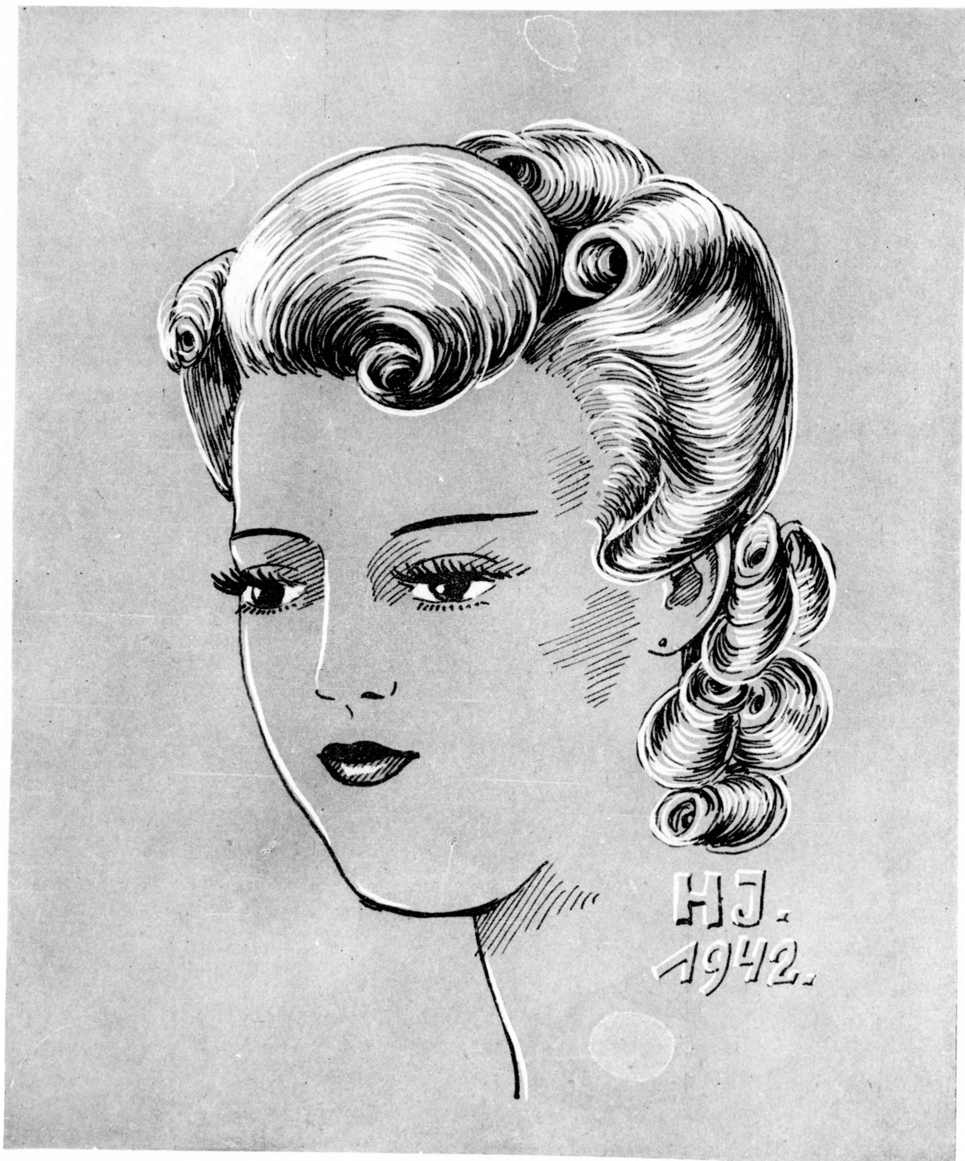
Délutáni frizúra fiatal lányok részére.