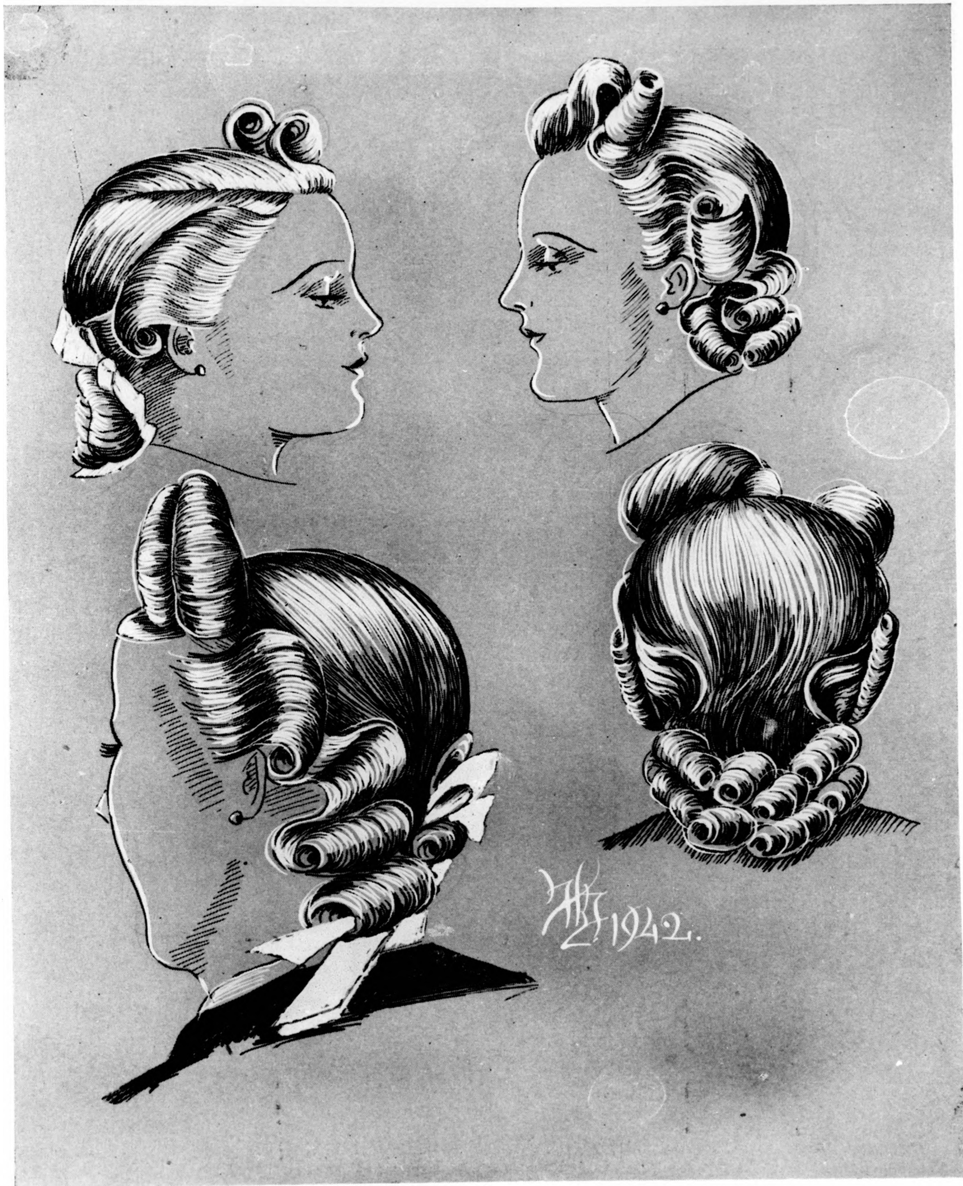
Különbözö nyari divat-frizurák.