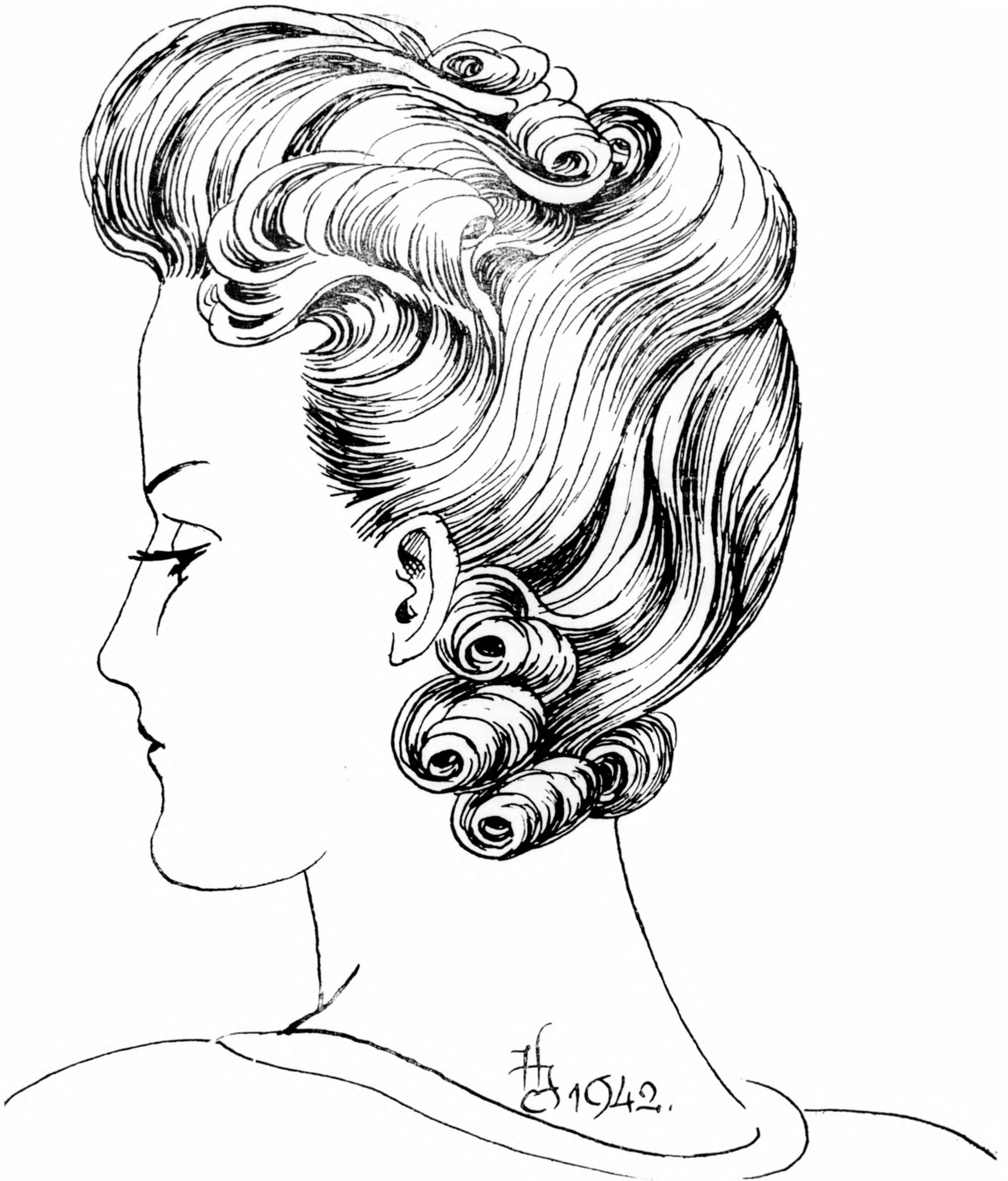
1942-es új divat forma.