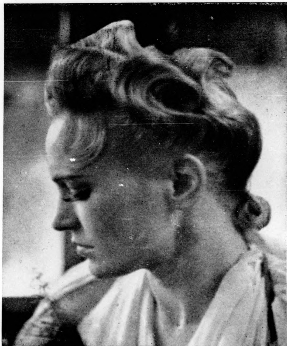
Nemzetközi és országos verseny nagydíjat nyert frizurái