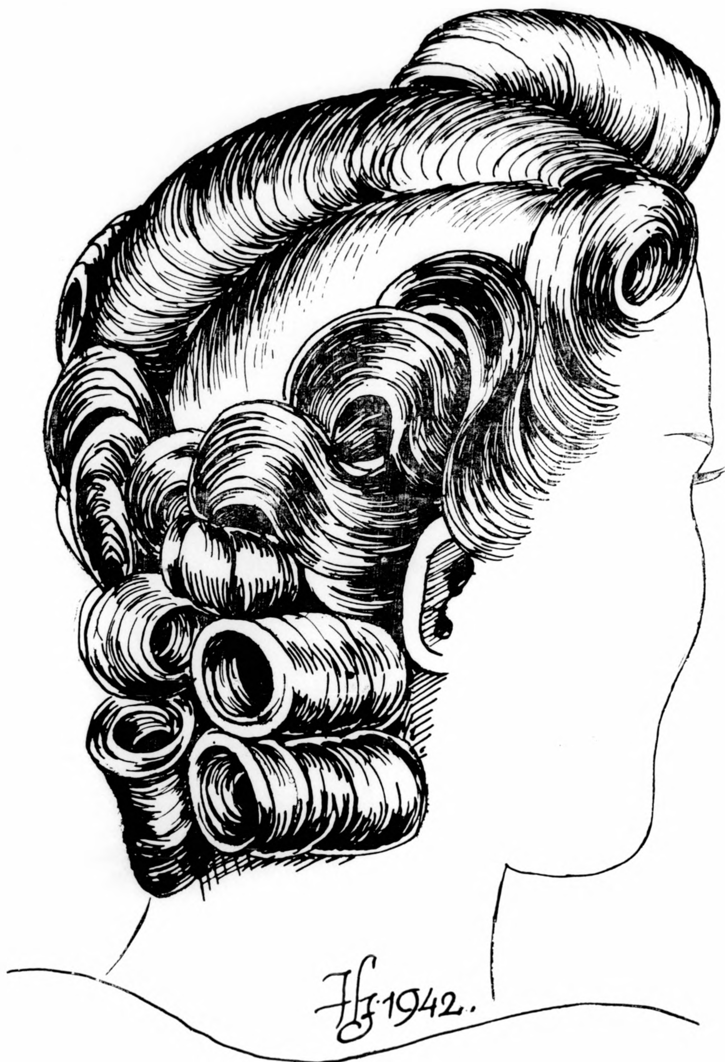
Uj farsangi frizura