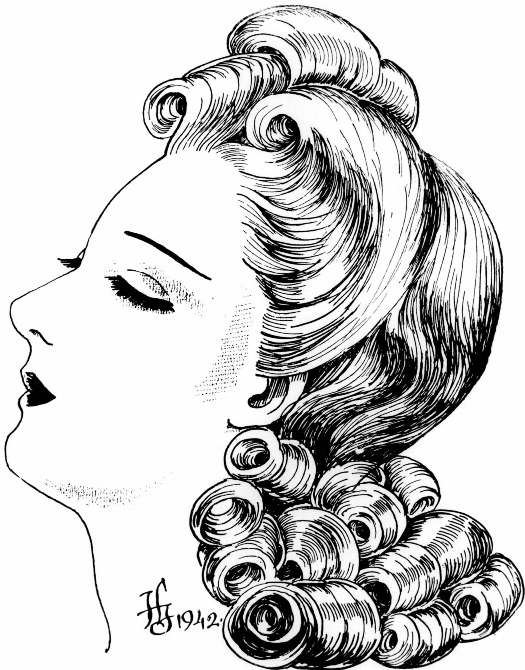
Új modern kreáció