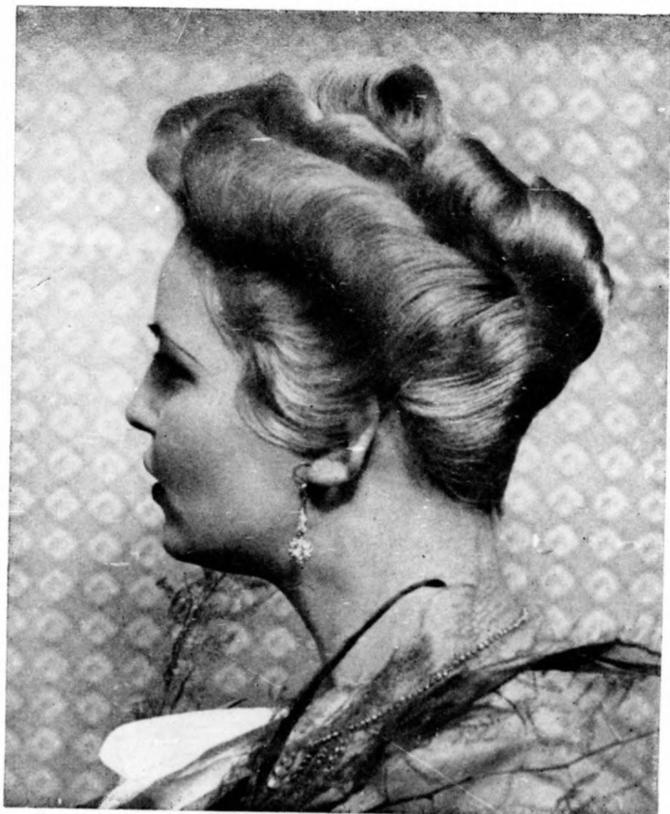
Frizurák a nemzetközi és országos páróka versenyéről