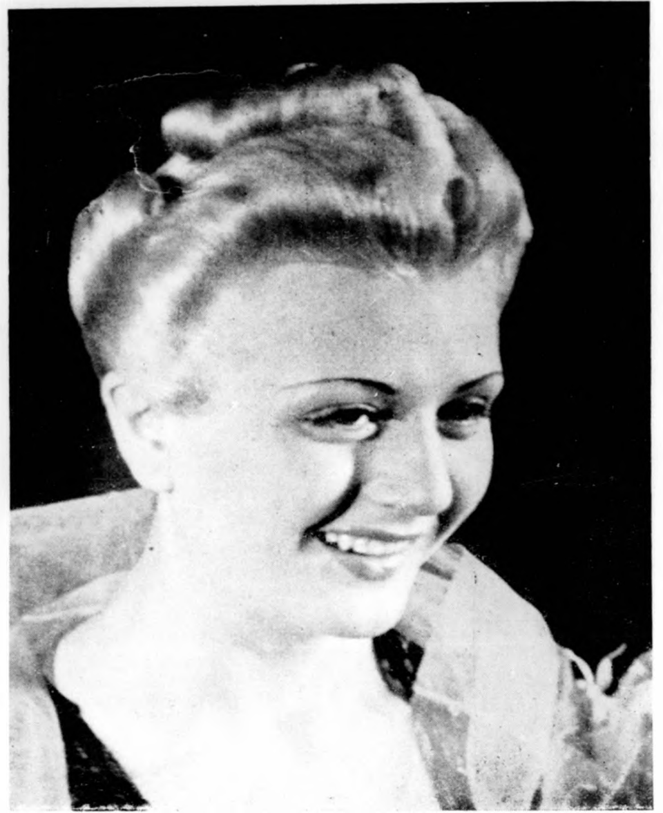
Nemzetközi verseny nagydíjat nyert frizurái.