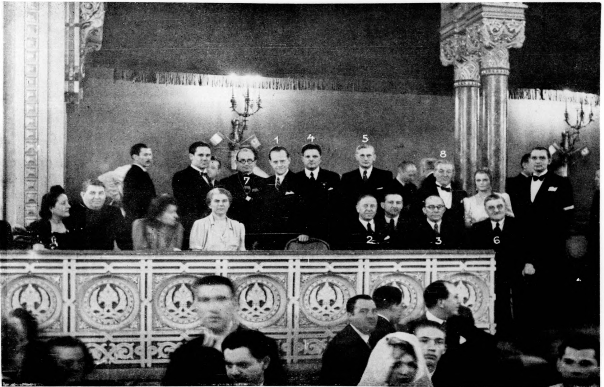
Felvétel a nemzetközi és országos fodrászversenyéről.

lyet a hölgyek rendszerint egyedül készítettek és hagyták a nyakukra feküdni, sőt a ruhára, a multé már. A nyak az új frizura szerint szabad marad, csak nagy estélyi ruháknál lesz alkalmazva, egy pár rövid lokni rész, hogy esetleg a nyak formát jobban kidomborítsa. Képekben, melyeket lapunk e számában mutatunk be, mind azok (kivéve a nagy képeket), amelyek a nagyversenyen a nagy díjakat nyerték. Az ábrák után, amelyeket a legjobb fodrászok készítettek el, alkalma van mindenkinek látni, hogy az új frizura formák minden tekintetben a női szépség emelését szolgálja. Magyarország fodrászait bátran mondhatjuk Európa fodrászdivat tervezőinek.