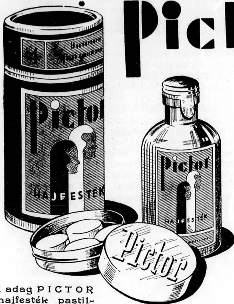
1 adag PICTOR hajfesték pastil- lával P. 2.62.