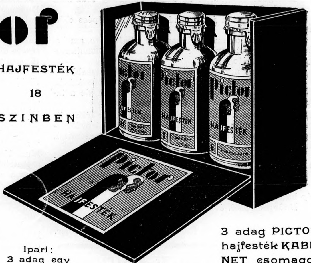
Ipari: 3 adag egy szinben P. 4.20