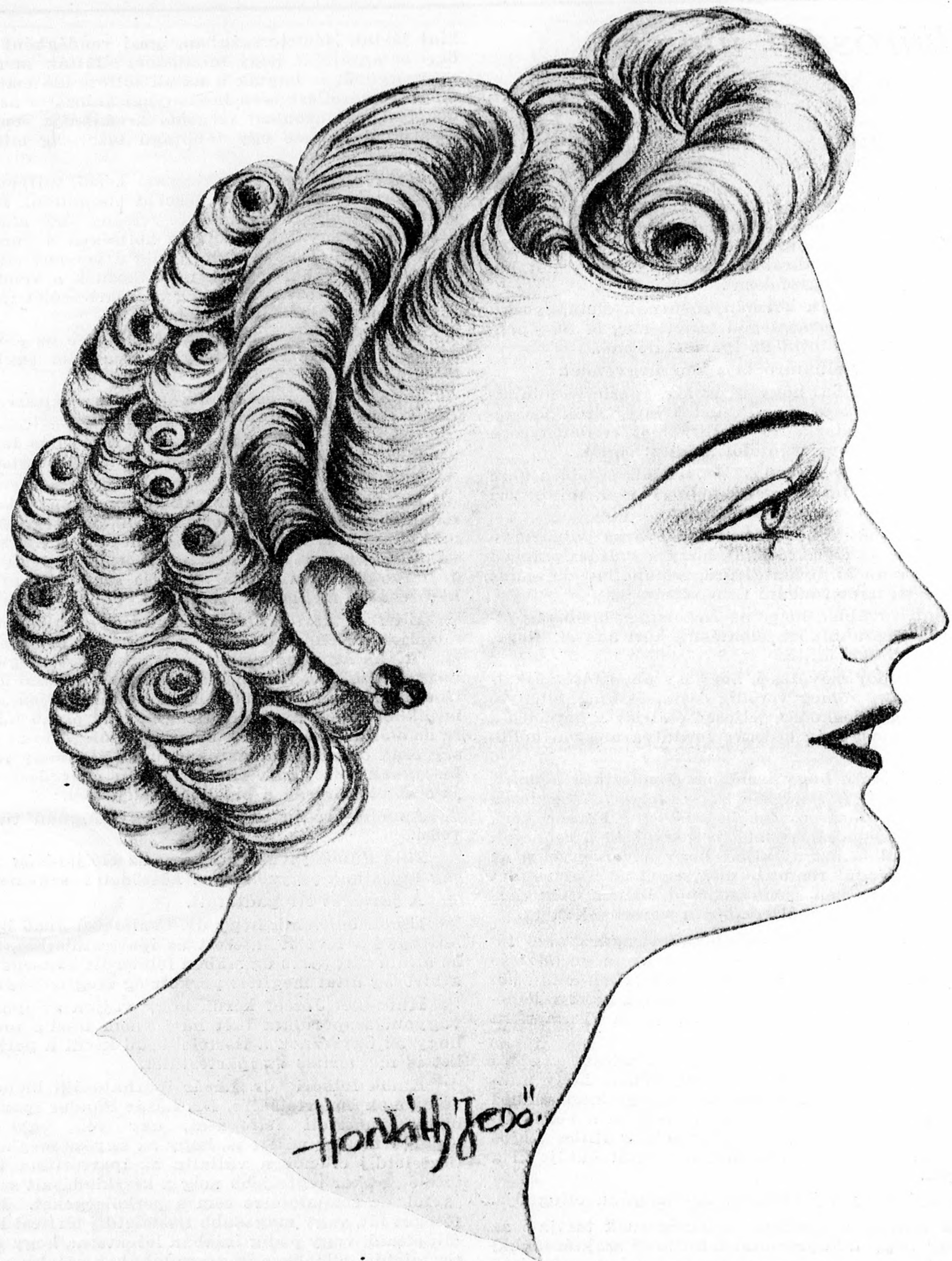
Legújabb őszi divatfrizurák.