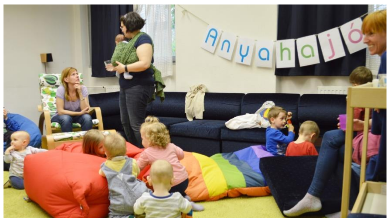
Nem baba-mama klub! Szervezői megbeszélés az alakuló anyaközpontban

A helyi mozgalom indulásakor a József Attila-lakótelepi anyák fokozatosan aktivizálódtak, a közösség maga fejlesztette magát és lett egyre szervezettebb.