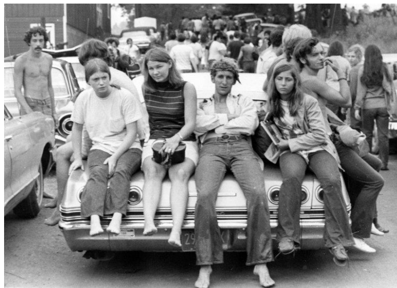
Fiatalok Woodstockban

Új korszellem, új életforma. Generációs váltás – középpontban az ifjúság! A „nagy generáció” megszületése.