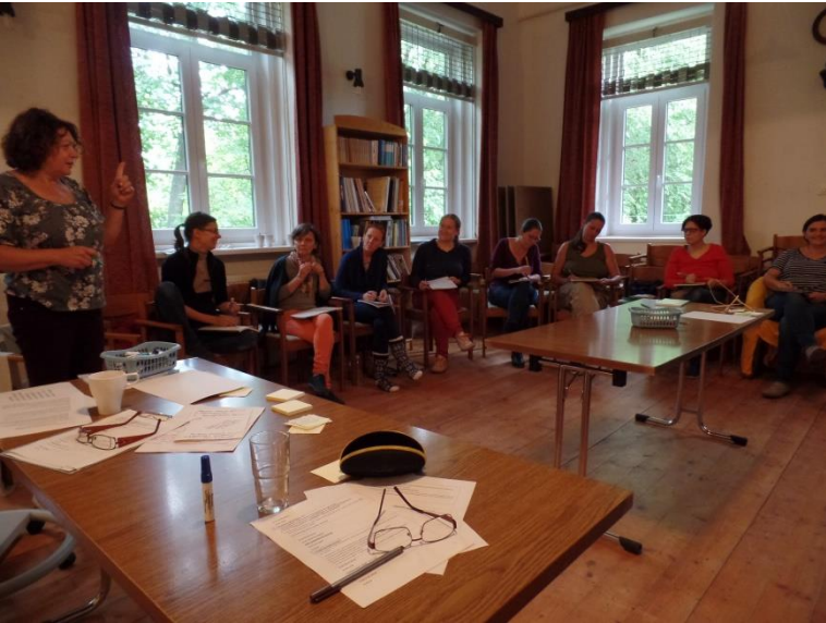
2017 szeptemberében elvonultunk egy hétvégére a kunbábonyi Civil Kollégium szervezetfejlesztő képzésére

Azt is megtudtam, hogy hová fordulhatok ezért.