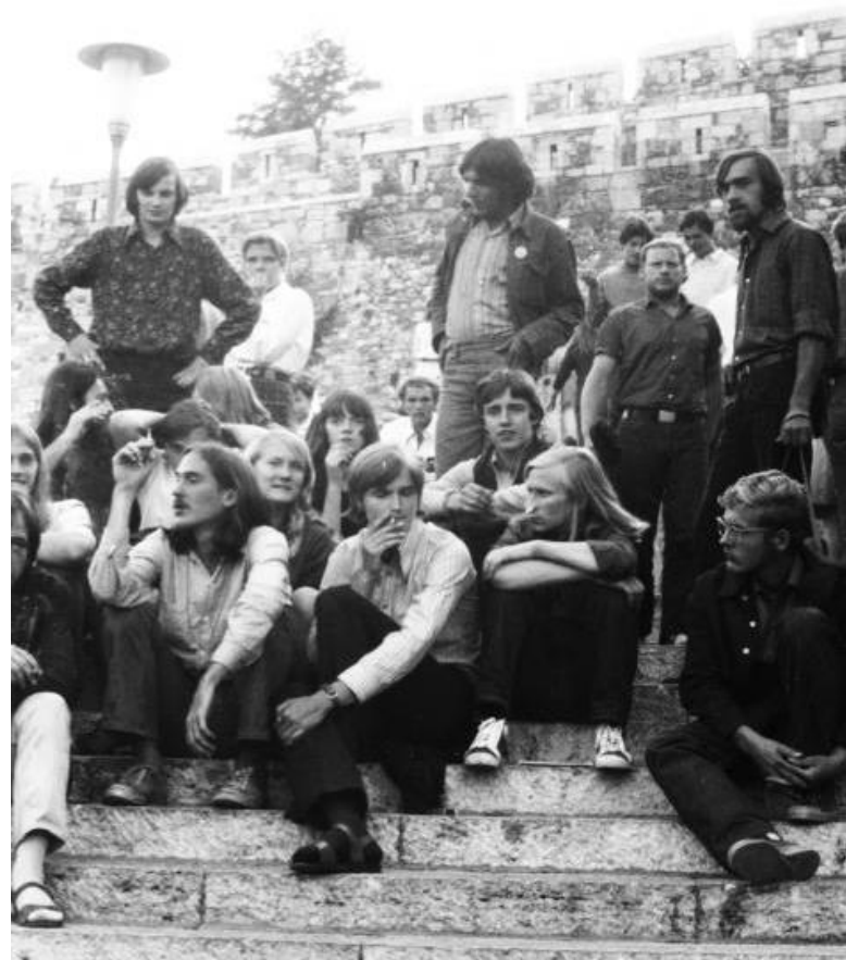
Budapest, 1969