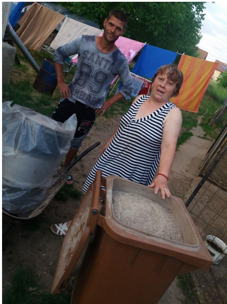
Hamus néni, Edelény

Császtai Búcsú főzőversenyét. A menüt önállóan állították össze, a roma hagyományos konyha és az újonnan megismert kerti zöldségek kombinálásával. A zsűrit nem csak a mángoldos, babos csirkés tészta nyűgözte le, hanem a töklekváros fánk is. A győzelem értékét növeli, hogy a kertészek elmondása szerint ezt a versenyt még soha nem nyerte roma csapat.