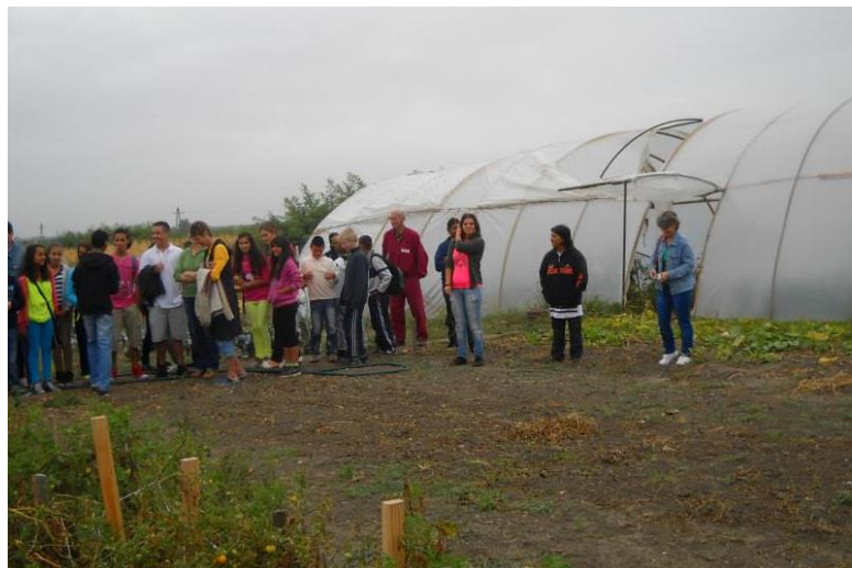
Hejőkeresztúri iskolások Hejőszalontán

Átéltették azt az élményt, hogy a mélyszegénységből jó példát tudnak mutatni az elvégzett feladatokkal a saját gyerekeiknek és azok osztálytársainak egyaránt. A büszkeség kölcsönös volt: a gyerekek jó példát láttak maguk előtt a szüleik munkája kapcsán, a szülők pedig valódi értéket előállítva mutattak utat a gyerekeiknek saját jövőjükhez kapcsolódva.