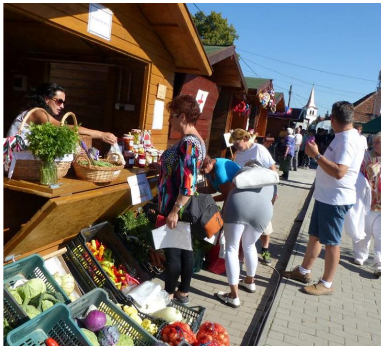
Pro Lecsó Piac

A polgármester asszony kapcsolatrendszerének köszönhetően ismerte meg programunkat Sajókeresztúr polgármestere. A településvezetőkkel folytatott tárgyalások során merült fel egy térségi összefogás ötlete a vegyszermentes gazdálkodási program köré csoportosítva, s egy megnyert Norvég Civil Alap pályázat által valóság is vált egy 8 települést összekötő projekt Hejő-Sajó: Fő a közös Lecsó címmel. A közel 2 éves program ideje alatt a településvezetők között kialakult párbeszéd kapcsán az érintett települések intézményei, azok munkatársai és a velük kapcsolatban állók között egy nagyon aktív viszony alakult ki. Az intézmények kapcsolatának köszönhetően sok közös program, ismeretterjesztő előadás és esemény gazdagította a településen élők mindennapjait.