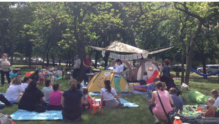
Első nagy rendezvényünk: a Ferencvárosi Közösségi Alapítvány Közterek pályázatán nyert Mobil anyahajó avatási ünnepe