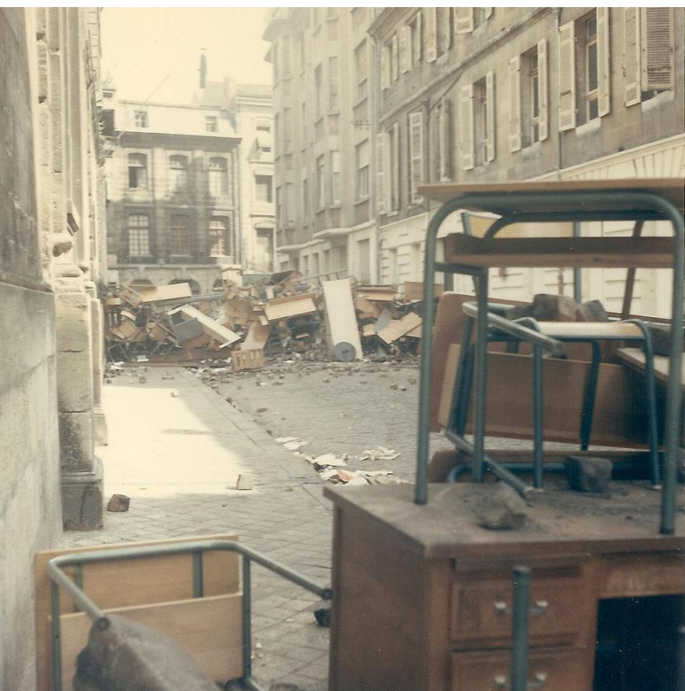
Barikádok Párizsban