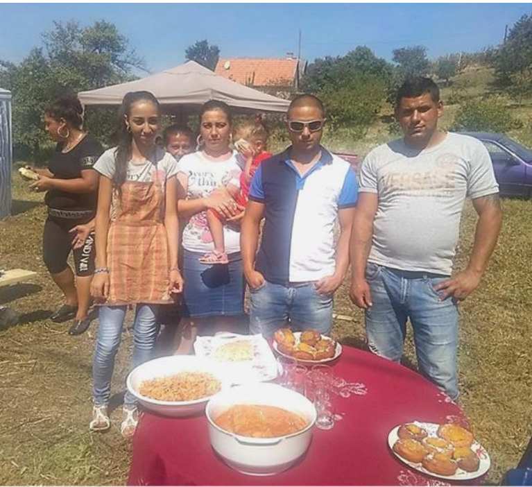
Császtai Búcsú, Edelény

A következő lépésünk a gazdálkodási és közösségépítő folyamatban, hogy kiderítsük, a 3 év alatt megtanult és készség szintűvé vált vegyszermentes