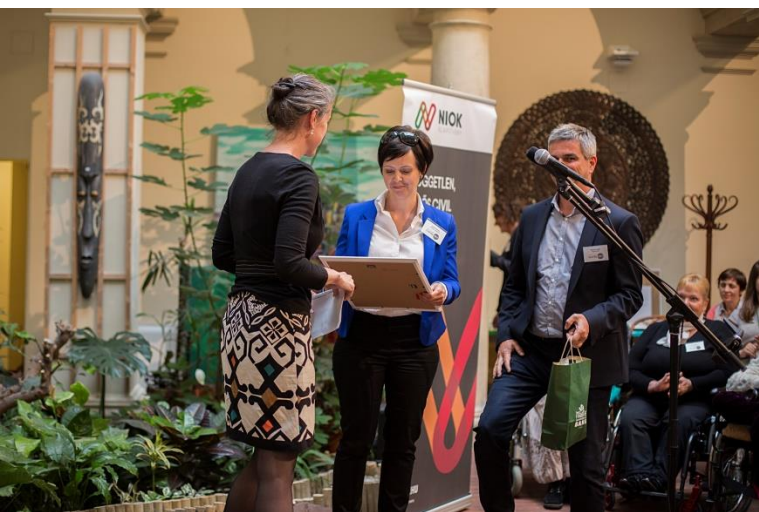
Civil Díj 2017

zó szerepet, távlati dolgokkal pedig nem foglalkoztunk. Nem fordítottunk gondot a további tervezésre (stratégia) és elhanyagoltuk szépen kiépített külső kapcsolatainkat.