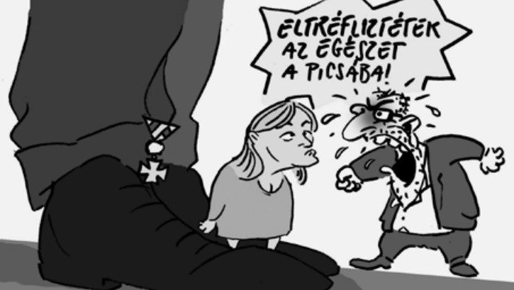
Pápai Gábor karikatúrája

is elég érdekes, hiszen amikor Kertész azt nyilatkozta, hogy „ne minősítsen engem magyarnak” 5 vagy „nem tudom, mi az a zsidóság”, 6 illetve „a nemzeti és faji meghatározások rám nem vonatkoznak” (nem senkire!! „rám”!!!), akkor éppen arról tesz tanúságot, hogy legfőbb élethozadékaként csak saját magára van tekintettel – vagy még magára sem (s ennyiben a következetessége része az önmaga következetlenségeinek ellentmondásokat föloldó elfogadása is) –; Kornis Mihály ezt elég jól fogalmazta meg Ki hogy ír? című ünnepi kis ajándékversében az Élet és Irodalom 1999. karácsonyi számában: