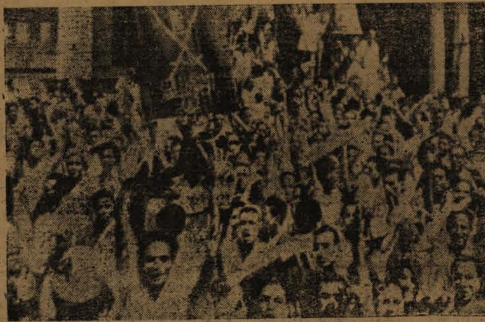
A kínai ifjak a béke mellett tüntetnek

Sztálin elvtárs arra tanít, hogy az intervenció korántsem merül ki hadseregek bevetésében és hogy a hadseregek bevetése egyáltalában nem jelenti az intervenció alapvető sajátosságát. Az imperiálizmus a jelenlegi körülmények között inkább a függő országokon belüli polgárháborúk szervezése útján, az ellenforradalmi erőnek a forradalom elleni finanszírozása útján, kínai ügyökeiknek a forradalom elleni erkölcsi és pénzügyi támogatása útján akar beavatkozni. Sztálin elvtárs 1926-ban rámutatott, hogy az ellenforradalmi tábornokok harca a forradalom ellen Kínában teljesen lehetetlen lett volna, ha ezeket a tábornokokat nem ösztökölték volna a világ imperiálistái, ha ezeket a tábornokokat nem látták volna el pénz-