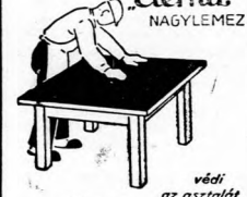
védi az asztaltól Hygienikus, tetszeltség.

Schuster Viktor előadása után a törvényező Áltörvényező "Eternit" NAGYLEMEZ