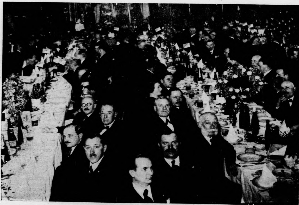
Az estebed közönsége, jobbról Abony küldöttsége.

A vacsora közönsége hosszú ideig maradt együtt.