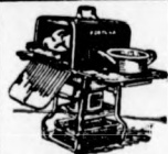
Fortuna főz, süt, fűt

Kiadja: A Rádió-Villamossági Kereskedők és Kisiparosok Országos Egyesülete