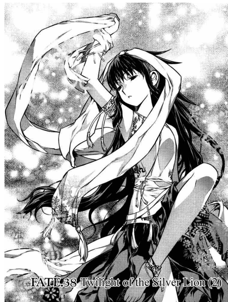
FATE.38 Twilight of the Silver Lion (2)

A történet világa alig különbözik az általunk ismert világtól. A 21. században játszódik, valós történelemmel és technológiai háttérrel. Az egyetlen lényeges különbség abban rejlik,