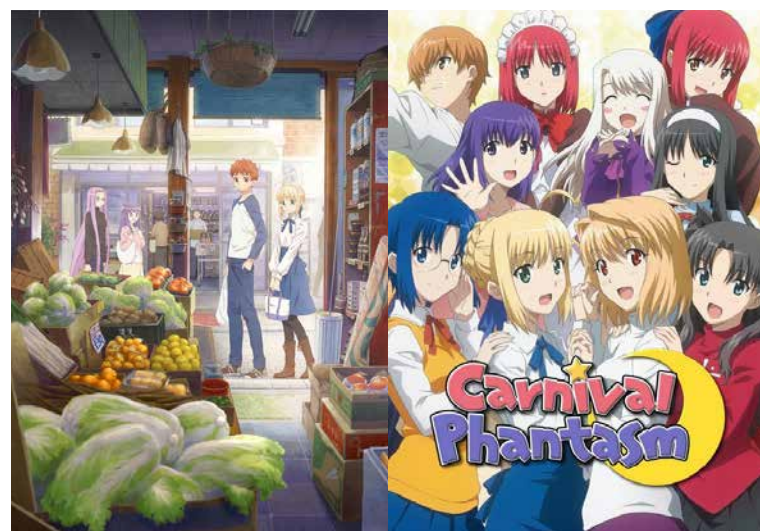
Carnival Phantasm (2012)

Itt több különálló címmel találkozhatunk. Mivel itt nincs időrend, a sorrend betűrend szerintire vált.