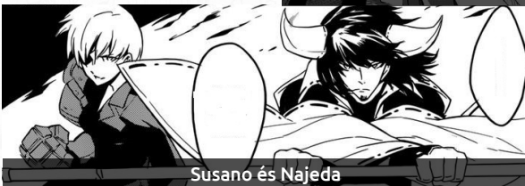
Susano és Najeda

Sheele: a csapat egy régebbi tagja, a fővárosban élt, azonban mikor a saját szemével látta a város valódi arcát csatlakozott a felkelőkhöz. Az a karakter, aki mindig ügyetlen, elejt vagy leüt dolgokat és ehhez hasonlókat csinál. Az egyetlen dolog amiben hibátlan, a gyilkolás, ahogy ő mondja, ez az ő tehetsége.