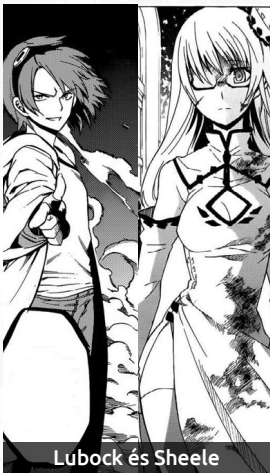
Lubock és Sheele

Susano: egy humanoid Teigu, aki később csatlakozik a csapathoz, mint erőstítés. Mivel ő egy Teigu, a felhasználója és ezáltal a mestere Najeda.