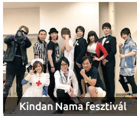
Kindan Nama fesztivál