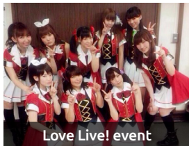
Love Live! event