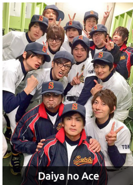
Daiya no Ace