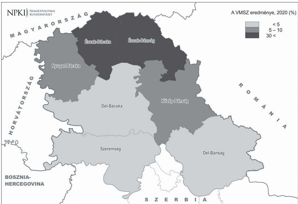
3. térkép: A VMSZ eredményének területi eloszlása a 2020-as parlamenti választáson