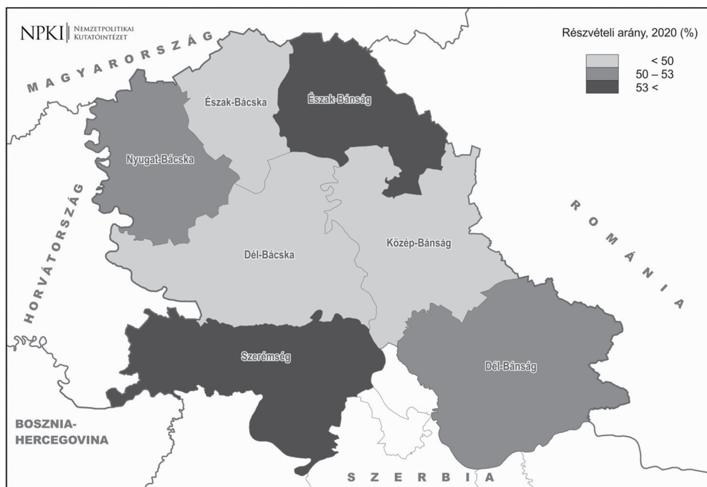
2. térkép: A parlamenti választások részvételi aránya a Vajdaság területén