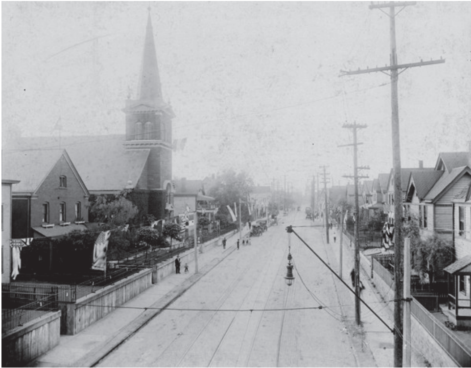
1. kép: A Szent Erzsébet római katolikus templom 1916-ban 12

1893. január 3-án egyházközségi gyűlés megszavazta Amerika első római katolikus templomának építését. 1896. február 15-én a templom (lásd 1. kép) ünnepélyes felszentelését Horstmann Ignác megyés püspök végezte. 11