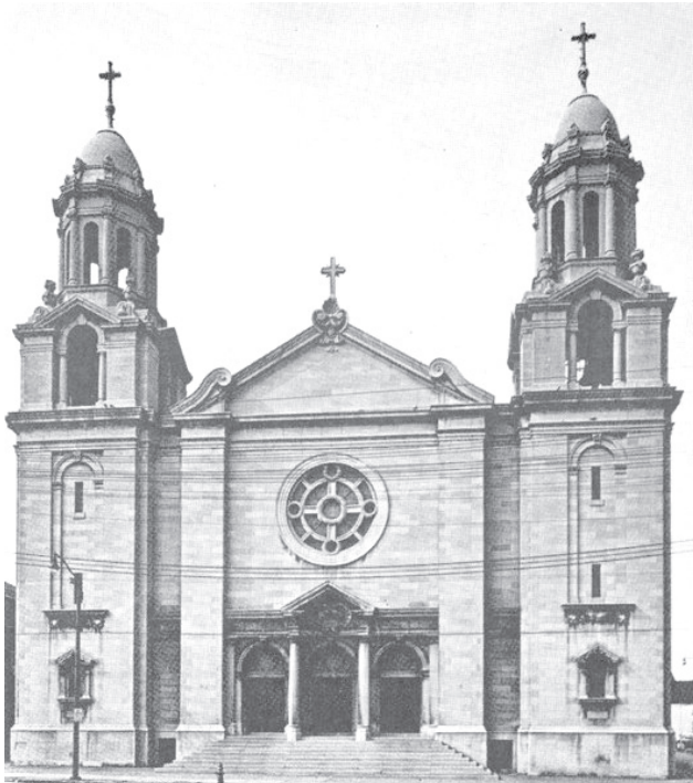
2. kép: Az új Szent Erzsébet római katolikus templom 1922 körül 16

építése 1914-ről 1918-ra tolódott. Az amerikai gazdasági élet, így a clevelandi ipar és gazdaság fellendülése 1918-ban lehetővé tette az új templom építésének megkezdését. Az alapkövetételének szertartását az akkori megyés püspök, J. P. Farrelly végezte. A templomépítés munkálatait az első világháború, a pénzhiány és az 1919-i rendkívül kemény tél késleltették. 1922. február 19-én Schrembs József clevelandi püspök megáldotta a templomot. Időközben az egyházközség létszáma egyre jobban növekedett. A már két segédlelkészt igénylő lelkipásztorra egyre több munka hárult. 1918-ban csaknem 1500 család tartozott az egyházközséghez, 455 keresztelezés, 108 esküvő és 206 (ebből 70 gyermek) temetés volt. Az általános 8 osztályú iskola 14 tantermében 1114 gyermek tanult. Az iskolában 13 szerzetes nővér és egy világi tanár tanított. A különféle felnőtt és ifjúsági egyletek több mint 2300 tagot számláltak. 14 Az 1920/21-es tanévben az egyházközség iskolájába beiratkozott tanulók létszáma elérte a mindenkori csúcst: 8 osztály, 16 tanterem, ahol 15 orsolyita nővér és 1 világi tanár 1159 tanulót tanított. 15