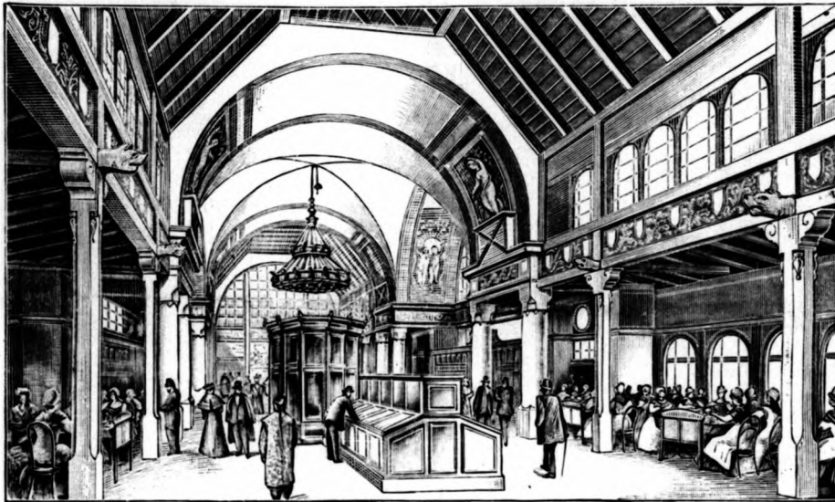
Loeser és Wolf-féle dohánypavillon belseje.

20—30 évvel ezelőtt a dohány egy csekély része szivarlevélnek is osztályoztatott, melynek ára egy bécsi mázsa után 16 frt volt. A vá-