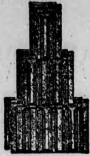
Nagykikindai gyártmány. Bohn-féle szab. biztonsági átfedő eserep 272. szám.

Képes árjegyzék és minták kívánatra ingyen és bérmentve.