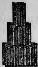
Nagykikindai gyártmány Bohn-féle szab. biztonságú átfedő cserép 272. szám.