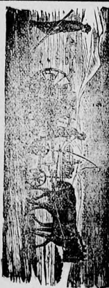
Legjobb sorveőgép, szekezőgép, fűnyalók, kúricica-mozgószék, daráló, sír-munkák, egyébolem acél-élek.

2- és 3-vasúti cské és minden egyébo gazdasági gépek.