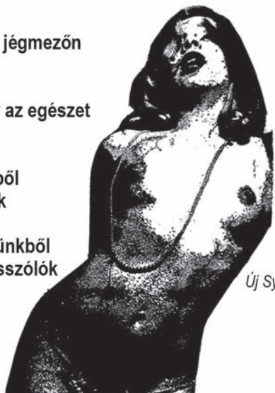
Új Symposion, Újvidék, 1970.

AKIT A MÁSIK VER kóserok! hol van hát a szégyenérzet – mindenki mindenkit kever