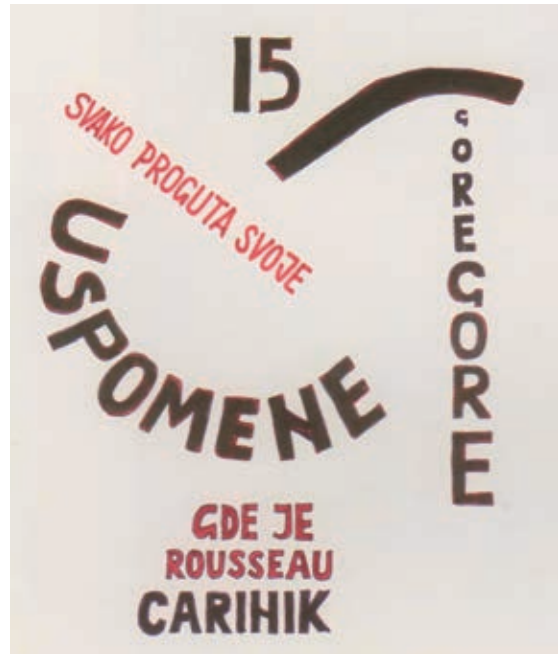
Kassák A ló meghal, a madarak kirepülnek című poémájának részlete eredetiben és Matković fordításában

Helyette került megrendezésre az ugyancsak kisebb haditettként elkönnyvelhető új magyar avantgárd kiállítás 1972-ben, b72 - fiatal budapesti képzőművészek címmel.