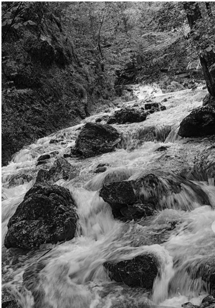
VEHOFSICS ERZSÉBET: KŐZUHATAG (részlet)