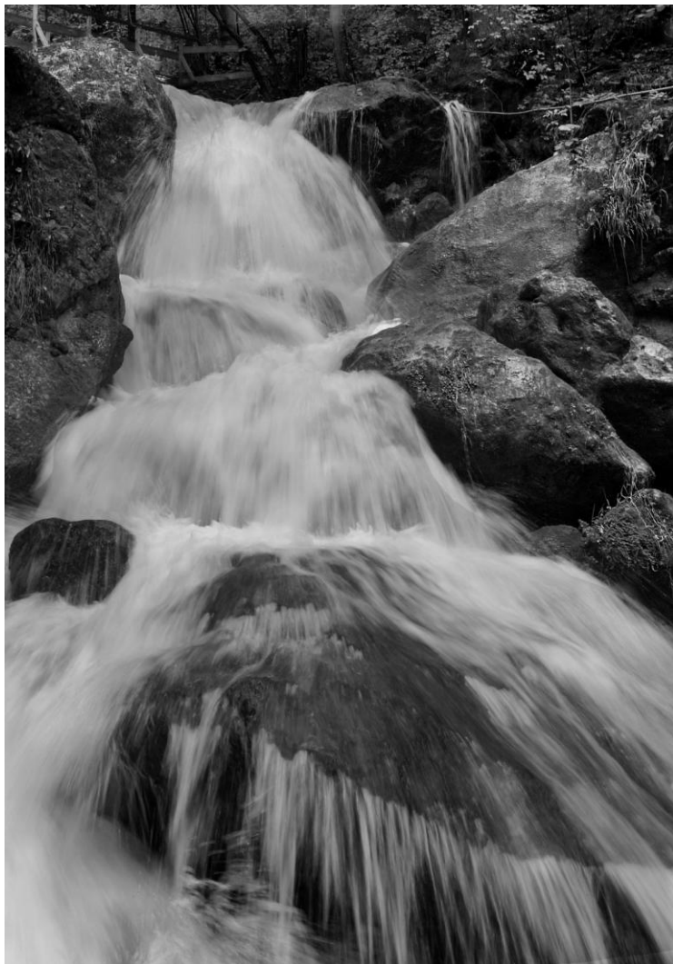
VEHOFSICS ERZSÉBET: VÍZFÁTYOL (részlet)