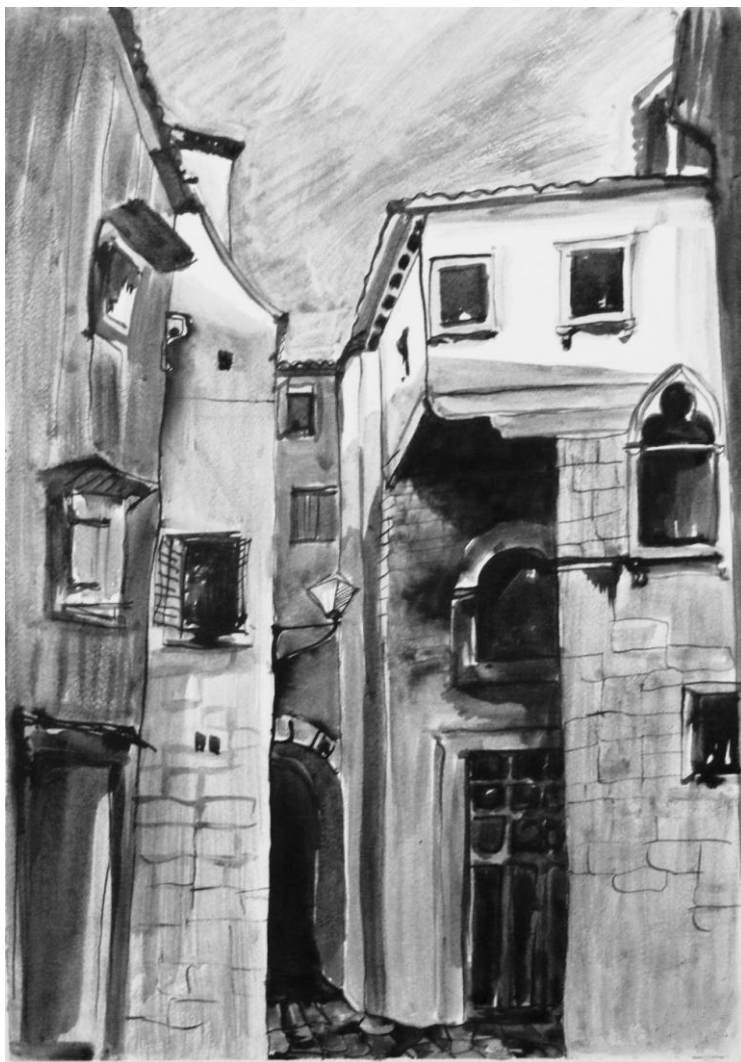
SZOKODI VERONIKA: SIKÁTOR II. (részlet)