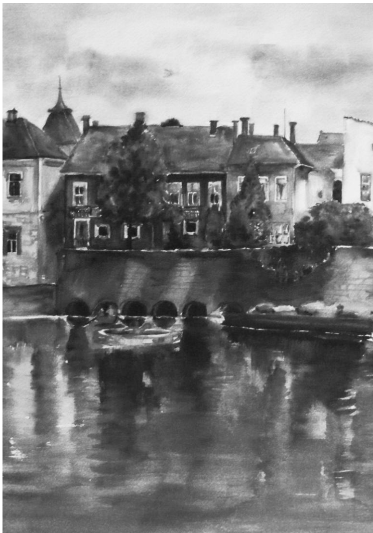
SZOKODI VERONIKA: MALOM-TÓ (részlet)