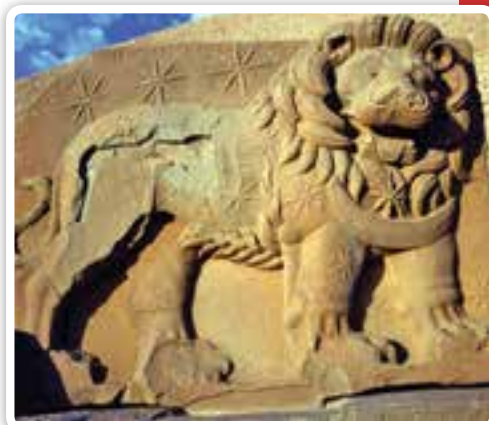
A Nimród-hegyi oroszlán az Orion-Nimród csillagképpel