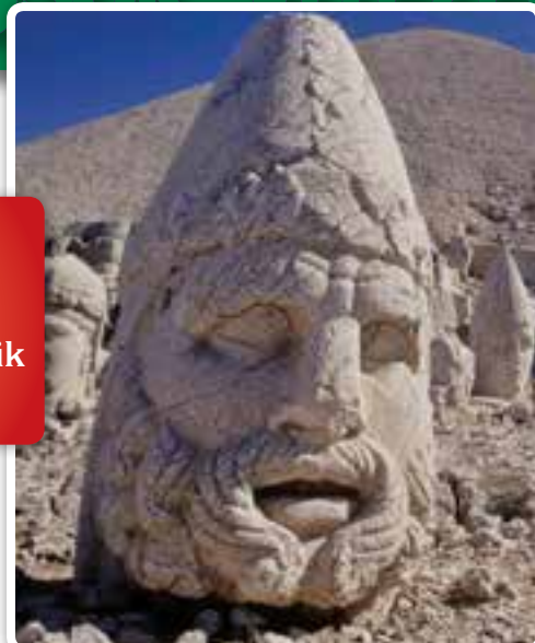
Nimród óriási kőszobrának romja a törökországi Nimród-hegyen

Milyen híres ikreket ismertek még a mondavilágból? Miben különbözik tőlük Hunor és Magor?