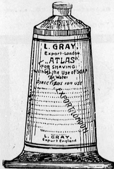
Nagy tubus K 1.—, kis tubus 70 fill.

Budapest, Váci-körút 78. (Pesti Hírlap palota.) Telefon 36-56.