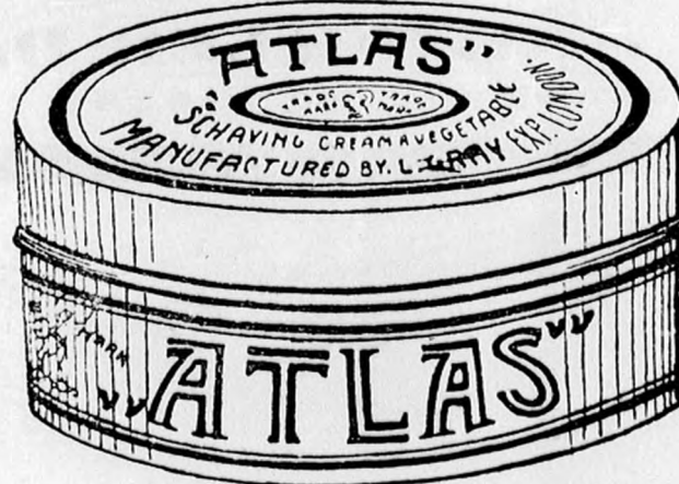
I kiló K 1.60.

„ATLAS“ borotváló krémet mutatójával kell a szakállra kenni, azaz csak megsimogatni és utána röktön meglepő könnyen borotvál; nincs oly kényes szakáll, mely borotválás közben kipattanna, bármily soká és erősen is utána borotvál.