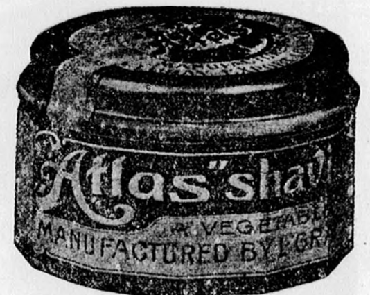
Üveg tégely 80 fill.

Ajánlja aczéláru raktárát és műhelyét minden e szakba vágó munkák pontos, jó és olcsó elkészítésére.