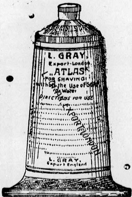
Nagy tubus K 1.—, kis tubus 70 fill.

Vidéki megrendelések pontosan eszközöztetnek.