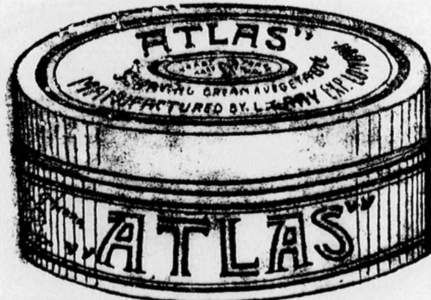
1 kilo K 1.60