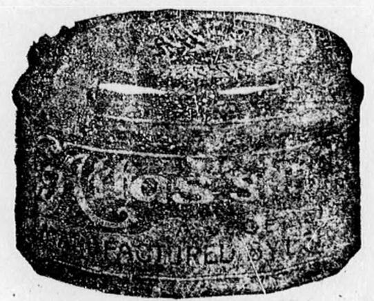
Üveg tégely 80 fill.

„ATLAS” borotváló krémet mutatóujjal kell a szakállra kenni, azaz csak megsimogatni és utána röktön meglepő könnyen borotvál; nincs oly kényes szakáll, mely borotválás közben kipattanna, bármily soká és erősen is utána borotvál.