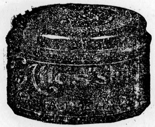
Üveg tégely 80 fill.

„ATLAS“ borotváló krémet mutatóujjal kell a szakállra kenni, azaz csak megsimogatni és utána röktön meglepő könnyen borotvál; nincs oly kényes szakáll, mely borotválás közben kipattanna, bármily soká és erősen is utána borotvál.