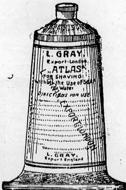
Nagy tubus K 1—, kis tubus 70 fill.

Vidéki megrendelések pontosan eszközöztetnek.