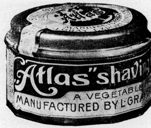
Üveg tégely 80 fill.

„ATLAS” borotváló krémet mutatóujjal kell a szakállra kenni, azaz csak megsimogatni és utána röktön meglepő könnyen borotvál; nincs oly kényes szakáll, mely borotválás közben kipattanna, bármily soká és erősen is utána borotvál.