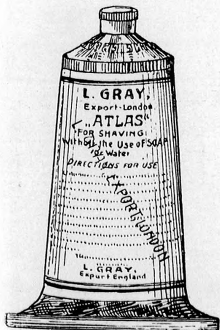
1 kilo K 1.60

BLEHA FERENCZ BUDAPEST, VI., Váci-körut 27. (Páris-szálloda mellett.)