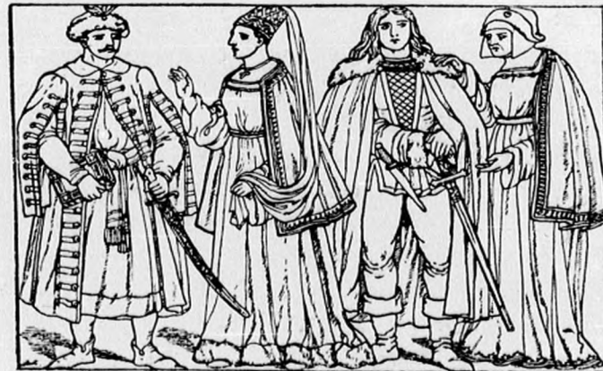
Magyar haj- és szakállviseletek.

kozás szokását is átvették, anélkül azonban, hogy az időpontot hitelesen megállapítani lehetne. A beretválkozás szokása a magyaroknál is csakhamar népszerűvé lett, úgy, hogy hol a körszakáll, hol a beretvált arc divott. A középkor végén általánosságban a beretvált arc volt a divat (lásd képünket.)