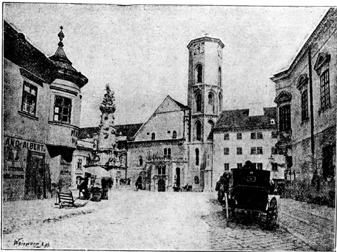
2. ábra. A templom régi homlokzata.

Midőn a templom restaurálása megkezdődött, kérdés tárgyává tétetett, vajjon miféle stílusban kívánatos annak helyreállítása. Kezdetben egy egységes stílusban