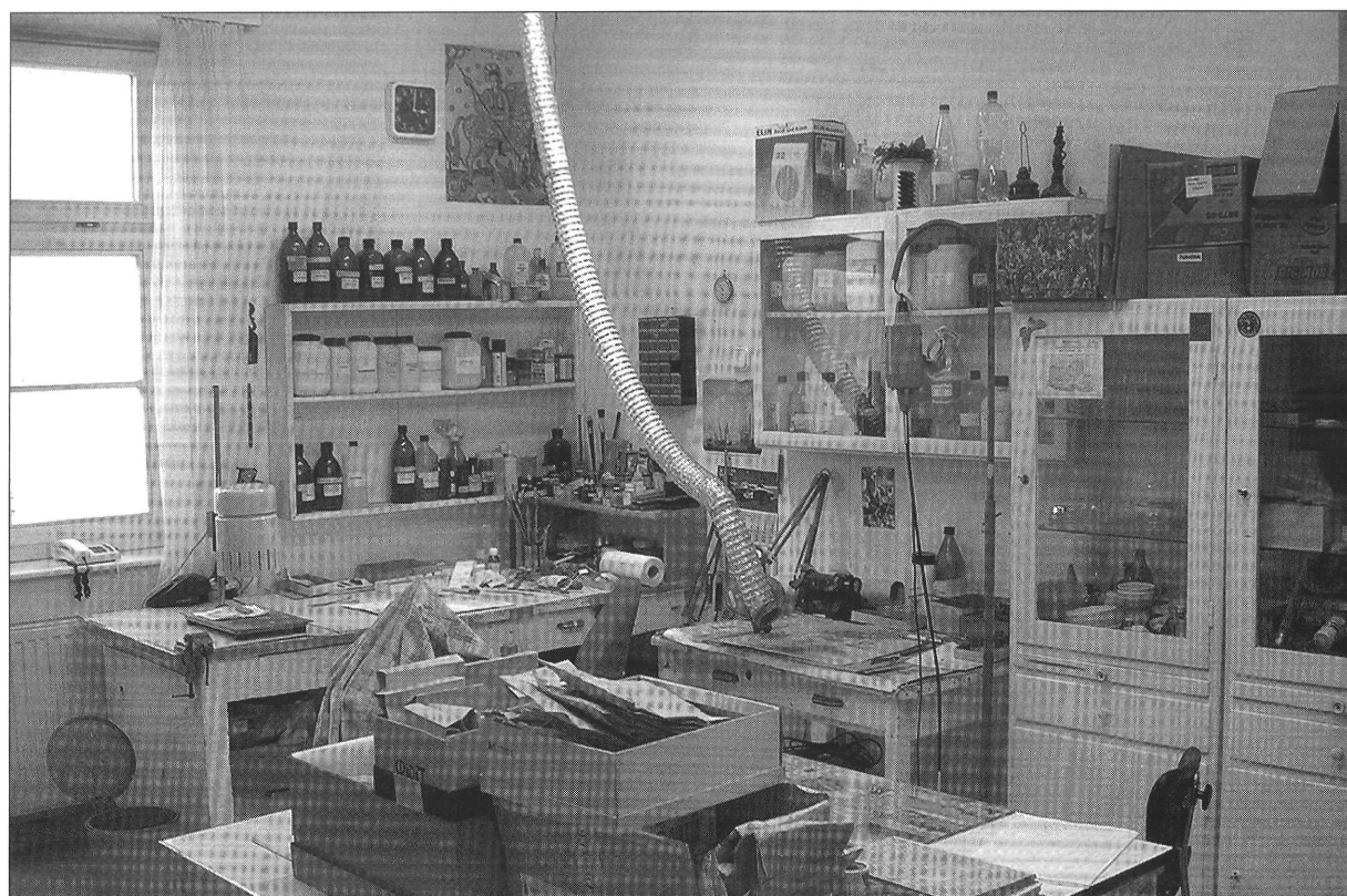
Fémrestaurátor műhely II. 2004.