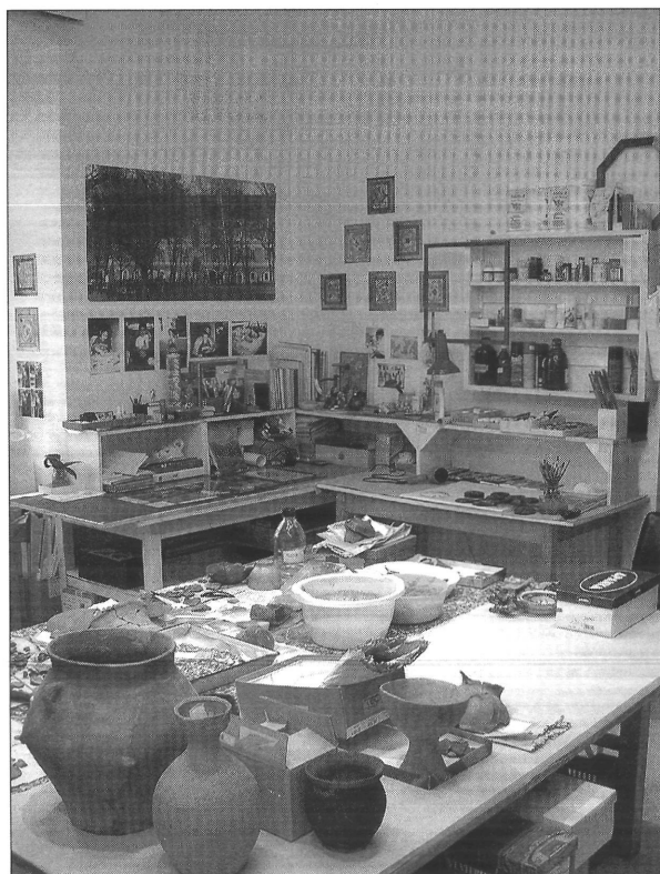
Kerámia restaurátor műhely 2004.