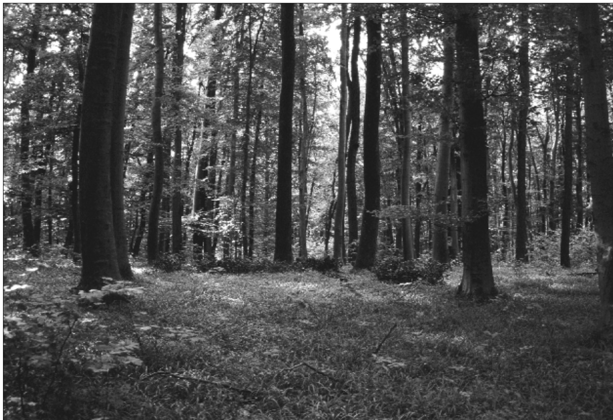
(2. ábra): A Dennai-erdő szép Vicio oroboidi-Fagetum állománya

A kitermelt faanyagot a bérlő MIR nagy részben saját mezőgazdasági bérleteinek ellátására használta fel, kisebb részben a kaposvári fatelepen értékesítette. Ezen kívül jelentős mennyiségben elégítette ki a tisztai, az altisztai és a gyártelepi alkalmazottainak, valamint az állandó munkásainak szükségleteit. A szállítás Lipótfá és Kaposvár vasútállomásig ökrökkel vagy lovakkal vontatott szekerekkel, onnét pedig vagonokkal történt. A vasút megteremtette annak a lehetőségét, hogy a zselici erdők fája nagy távolságra is eljusson.