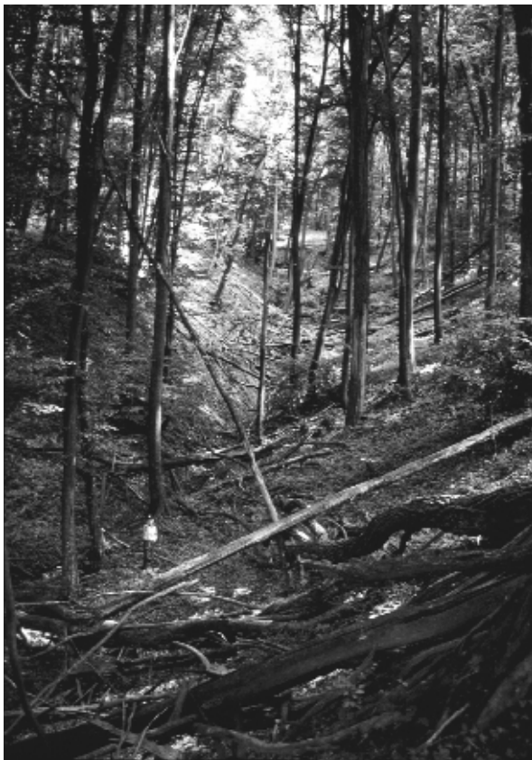
3. ábra: A 20. század elején a horhosokba telepített akác erősen pusztul

és így a korosztályok helytelen arányán 30 év alatt alig javítottak.