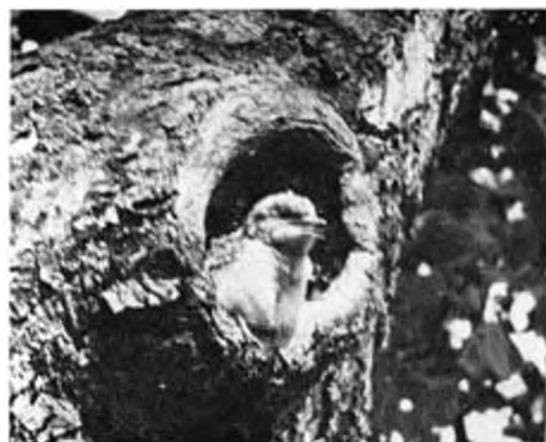
Nyaktekerecs. – Wendehals.

Nyaktekerceset hallottam és láttam Őszödön, Fonyódligeten, Fonyódon, Balatonújlakon és Balatonberényben 44 esetben a következő havi megoszlásban: IV:7; V:9; VI:19; VII:9 esetben, legkorábban: Balatonújlak, 1960.IV.3.