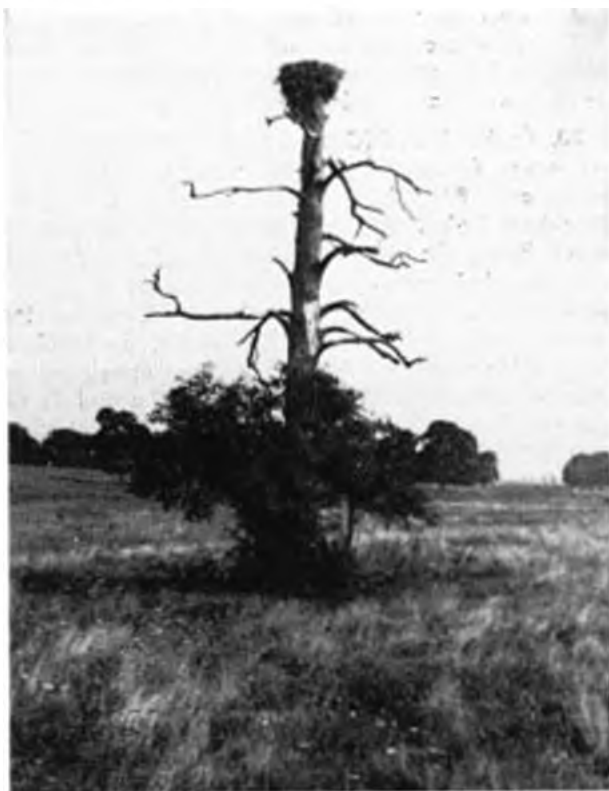
Gólyafészkek kiszáradt tölgyfán. – Storchnest on durrer Eiche. Főnyéd, 1976.III.

17. Fekete gólya ( Ciconia nigra ): Az irodalomban mindössze egy adat található – a halastavakon kívül –: Siófok, 1896.IV.10. (1) (GAAL), majd ODOR figyelte meg Balatonszemesnél 1949.IX.15-én. Magam az Or-