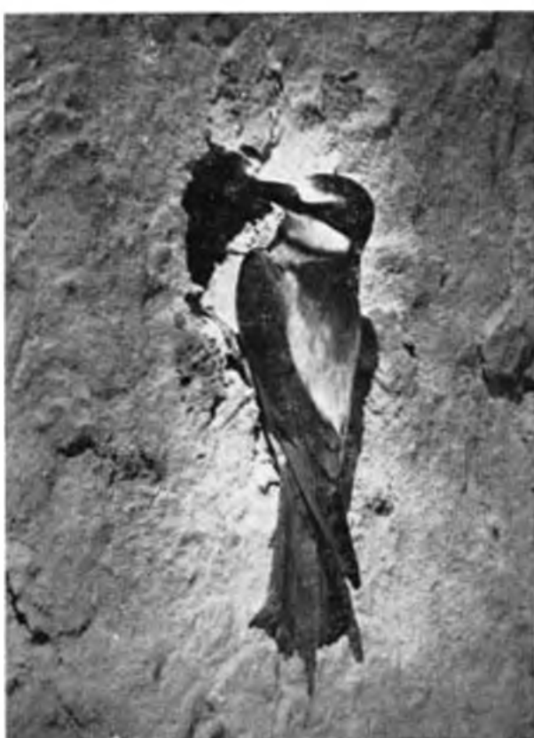
Gyurgyalag. – Bienenfresser.

144. Gyurgyalag ( Merops apiaster ): SZIKLA Balatonszemesnél 1883-ban a löszfalban parti fecskékkel