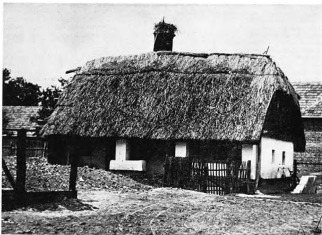
Gólyafészek madárhárítóval. – Storchnest mit Vogelscheuche. Balatonújlak, 1967. VI. 22.