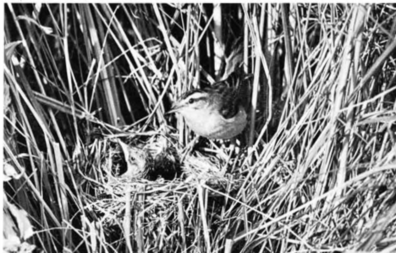
Foltos nádiposzáta. – Schilfrohrsänger.

Láttam Balatonberényben 1958.V.24-én (4–5 db a strand fán, nyilván vonulók), Fonyódon a falu parkjá-