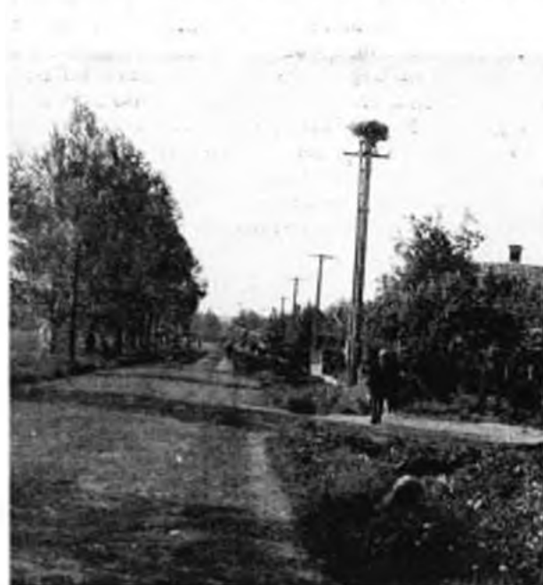
Betonoszlopon épült gólyafészek. – Storchnest an Betonsäule. Somogyzsitfa, 1973.