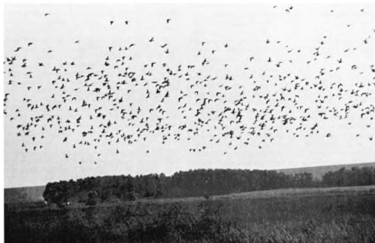
Athúzó tökéscréca-csapat. – Durchziehender Stockentenflug.

Magamnak 1946–72 között 385 megfigyelésem volt, melyek havi megoszlása a következő: I:7; II:13; III:35; IV:58; V:29; VI:17; VII:6; VIII:14; IX:69; X:68; XI:56; XII:13 eset. Sokszor még III-ban is a jégen pihenve találjuk a tökéscrécét. Nagyobb tömegeket észleltem: Balatonberény, 1949.XI.26. (600–800, sűrű csapatban zátonyon); XI.30. (800–1000 récének 80 százaléka); 1951.XI.20. (800–1000); 1952.XI.10. (600–800); Balatonszentgyörgy-part, 1961.VIII.30. (több ezer, MANNINGER); Jankovich-telep–Fonyódliget, 1961.IX.17. (500–600 erős vedlésben); Balatonszentgyörgy-part, 1962.