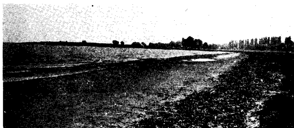
A Szentgyörgyi-öböl benádasodás előtt. – Die Bucht von Balatonszentgyörgy vor der Beschilfung. Balatonszentgyörgy, 1963.IX.13.

A vasúti töltésnek a Balatontól ellenkező oldala régi időktől fogva mezőgazdasági terület, erősen hullámos terepen. Aliga és Siófok között javarészüket el is kerítik, így itt a mozgás igen korlátozott lehetőségű.