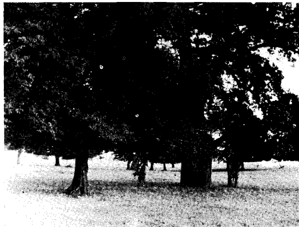
A fonyódi öreg tölgyes, a szalakóta, csóka stb. fészkelőhelye. – Alte Eichen-Au bei Fonyód, die Brutstelle der Blauracke, Dohlen, usw. Fonyód, 1976.VIII.

A legnagyobb összefüggő erdőség, főleg tölgyes és akácos csak helyenként bükk-állománnyal, Balatonkeresztúrtól Balatonszentgyörgyig, illetve délnek messze le Somogyba elhúzódik. Hollád, Tikos és Fonyód között a Kis-Balaton berkei messze benyomulnak az erdők közé, viszont az erdőség tagjának tekinthető a már síksági jellegű vörsi erdő. A fenti körülmények azonban arra mutatnak, hogy ezek az erdők inkább a somogyi dombvidéket, mint a Balaton-környéket jellemzik.