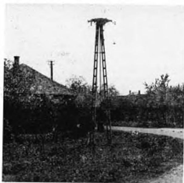
Betonoszlopon épült gólyafészek. – Storchnest an Betonsäule. Tóska, 1973.