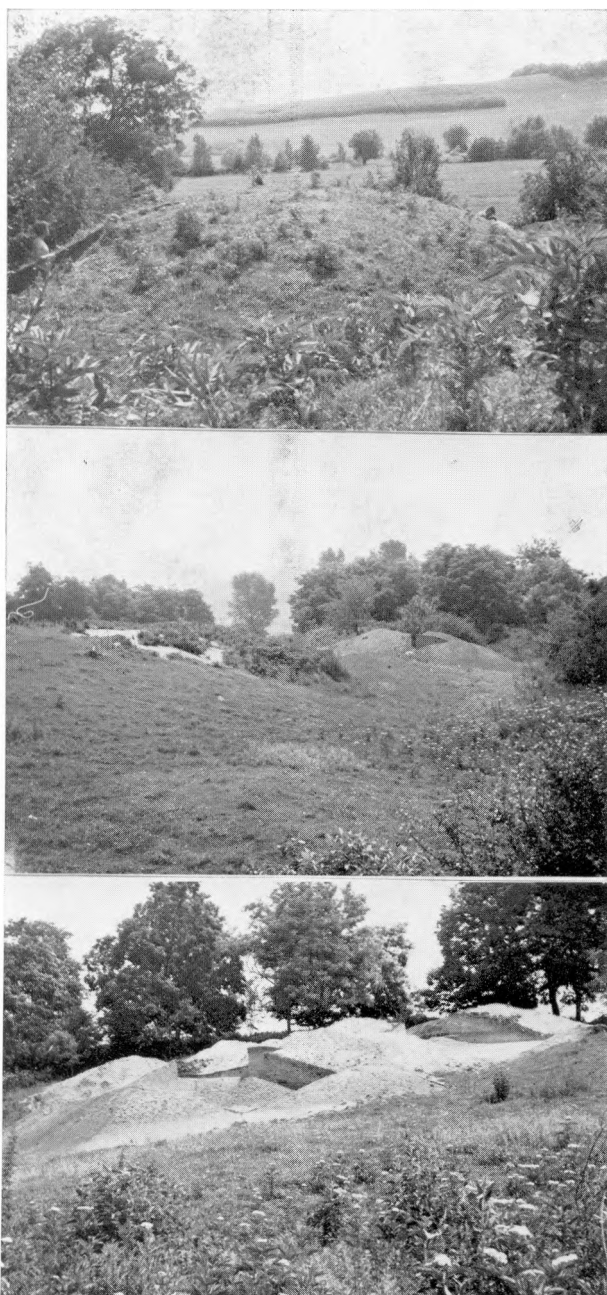
31. Nagyberki–Szalacska. Az 5., 6. és 9. halom. – Nagyberki–Szalacska. Hügel Nr. 5, 6 und 9.

csak egy halom alatt volt nagyméretű, viszonylag mély, négyszög alakú sírgödör. A kilenc halom közül egyet sem emeltek a máglya fölé, kivétel nélkül máshonnan hordták a máglya maradványait a sírhelyre. A faszenes, hamus réteg a hamvakon kívül csak a