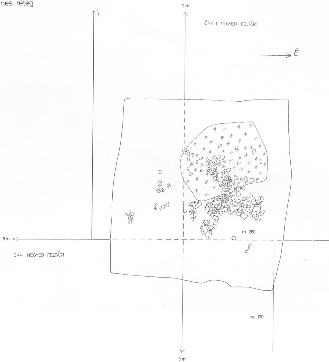
36. Nagyberki-Szalacska. A 8. számú halom sírjának rajza. – Nagyberki-Szalacska. Skizze des Grabes im Hügel 8.