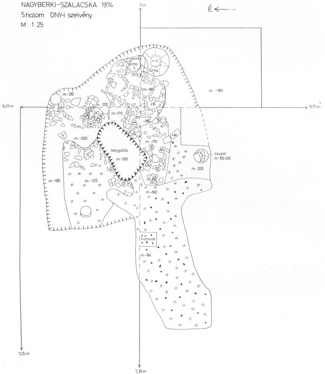
32. Nagyberki-Szalacska. Az 5. halom sírjának rajza. – Nagyberki-Szalacska. Skizze des Grabes im Hügel Nr. 5.