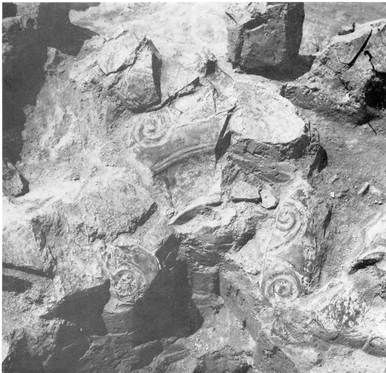
35. Nagyberki–Szalacska. Az 5. halom 3. sz. urnája. — Nagyberki–Szalacska. Urne Nr. 3 des Hügels 5.