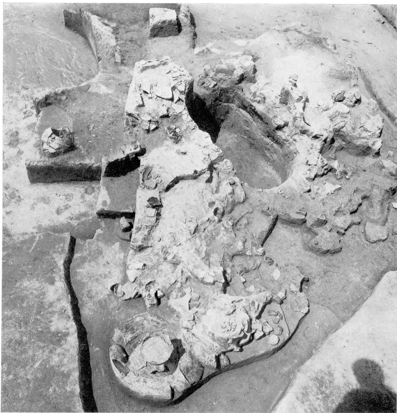
33. Nagyberki-Szalacska. Az 5. halom feltárás közben. – Nagyberki-Szalacska. Hügel Nr. 5 bei der Freilegung.