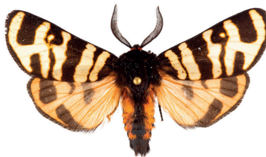
9. ábra. Díszes medvelepke – Arctia festiva (Hufnagel, 1766)