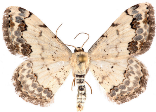
10. ábra. Tarka fehéraraszoló – Scopula decorata (Denis & Schiffermüller, 1775)