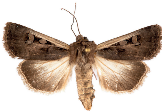
15. ábra. Fehérsávós földibagoly – Euxoa hastifera (Donzel, 1847)