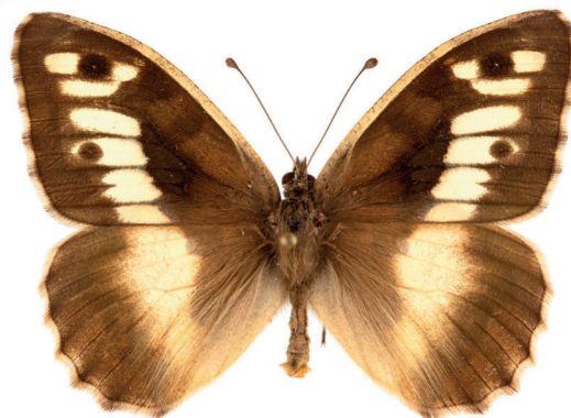
7. ábra. Tarka szemeslepke – Chazara briseis (Linnaeus, 1764)