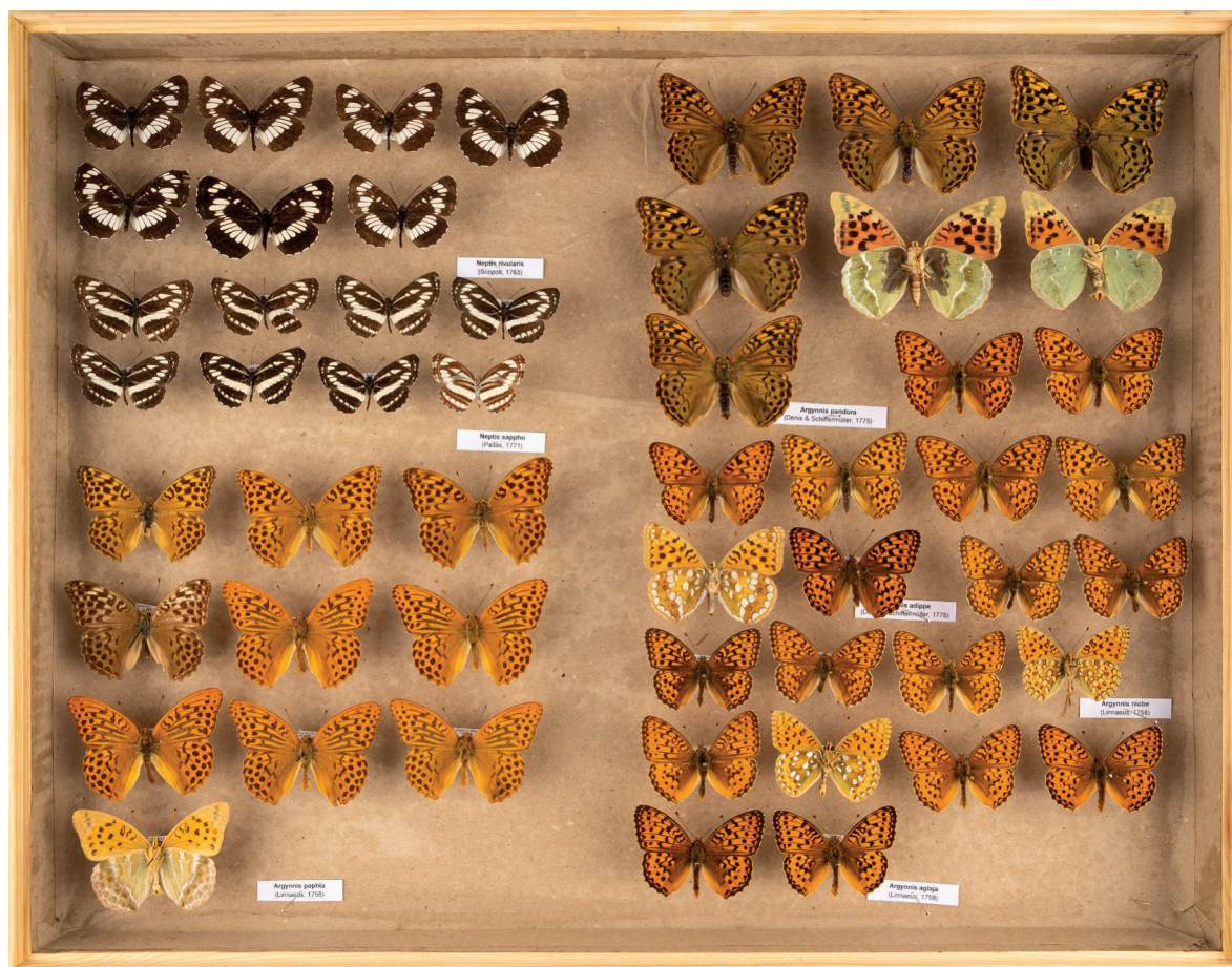
3. ábra. Nappali lepkék revízió után, az új dobozukban