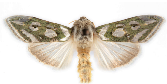
12. ábra. Ezüsfoltos csuklyásbagoly – Cucullia argentea (Hufnagel, 1766)