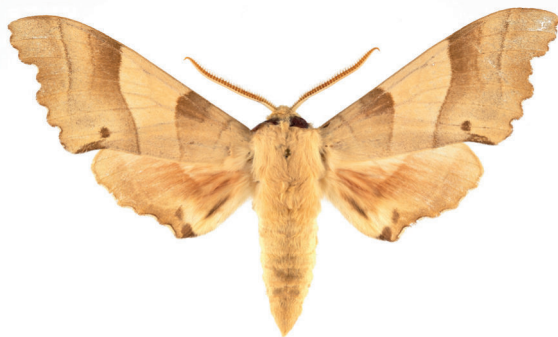
8. ábra. Tölgyfaszender – Marumba quercus (Denis & Schiffermüller, 1775)