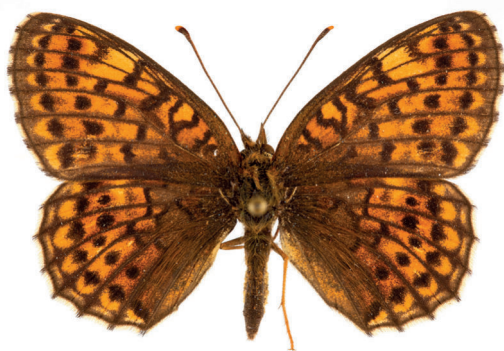
6. ábra. Rozsdaszínű gyöngyházlepke – Brenthis hecate (Denis & Schiffermüller, 1775)