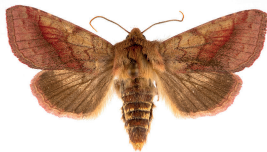
13. ábra. Ezerjófűbagoly – Pyrrhia purpura (Hübner, 1817)