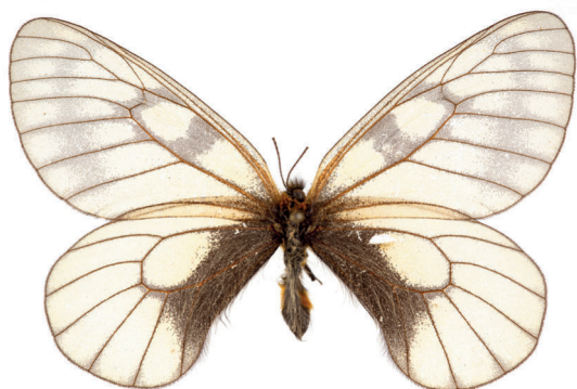
4. ábra. Parnassius glacialis Butler, 1866 apollólepke-faj Japánból, amely csere útján került a gyűjteménybe