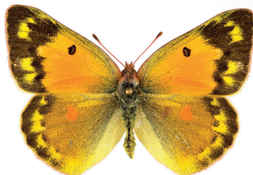
5. ábra. Dolomit-kéneslepke – Colias chrysotheme (Esper, 1781)