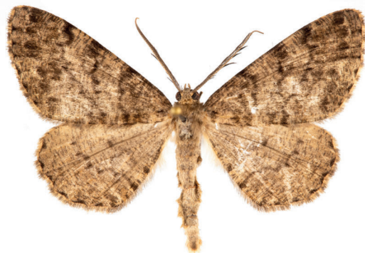
11. ábra. Fenyőrágó faaraszoló – Deileptenia ribeata (Clerck, 1759)