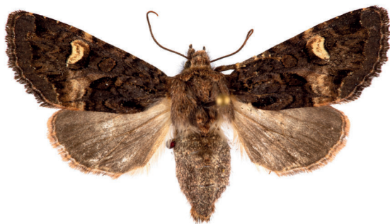
14. ábra. Zörgőlepke – Rileyana fovea (Treitschke, 1825)