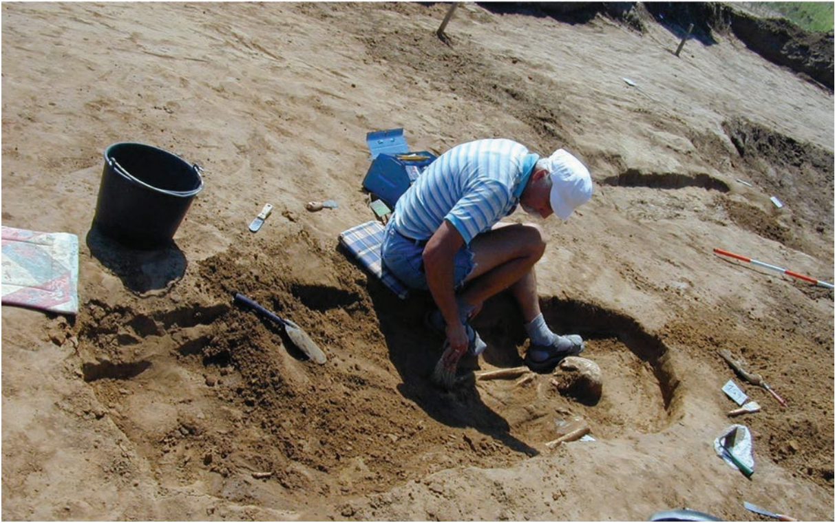
Költő László Vörs-Majori-dűlő ásatásán, 2001