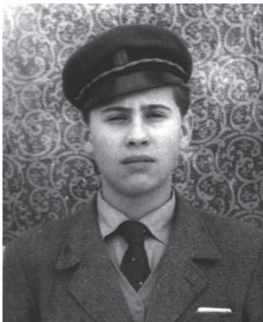
Vegyipari Technikum, Debrecen, 1963–1967