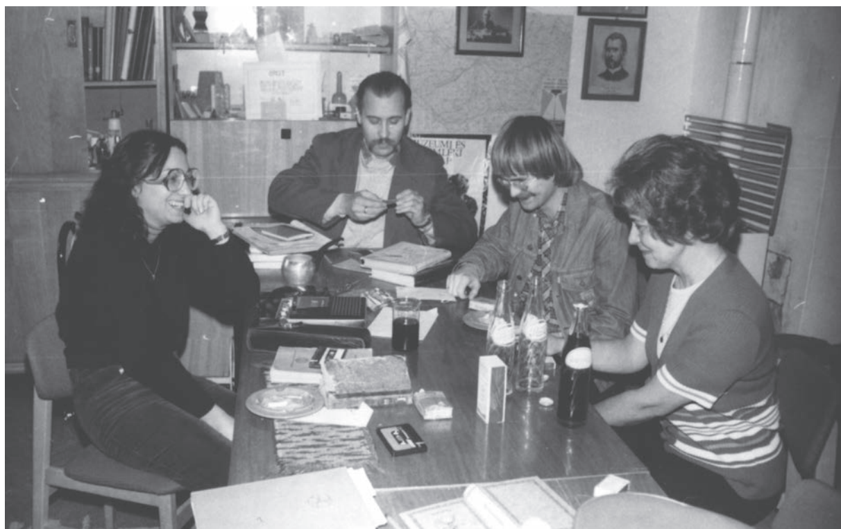
Várpalotai Vegyipari Múzeum, 1970-es évek