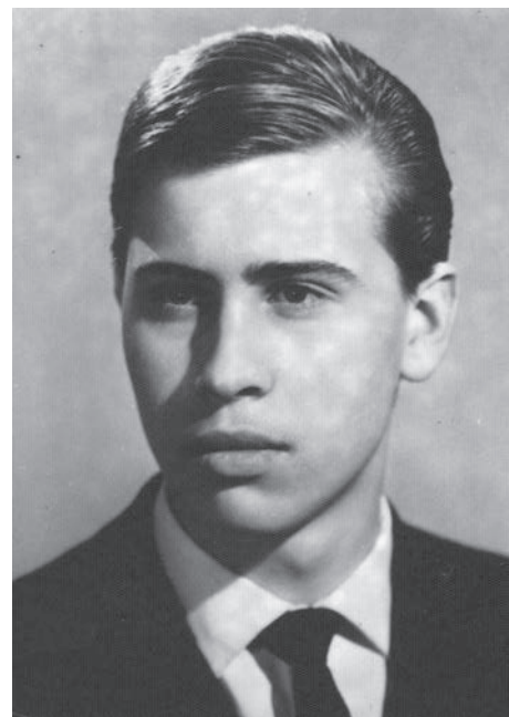
Érettségi tablókép, 1967