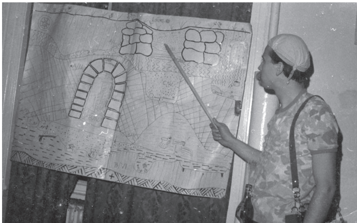
Tanszéki est, 1976