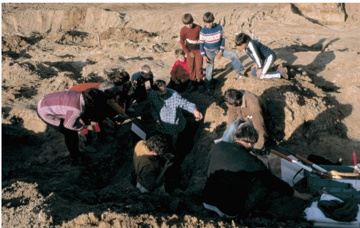
A vörs-papkerti ásatások, 1990-es évek