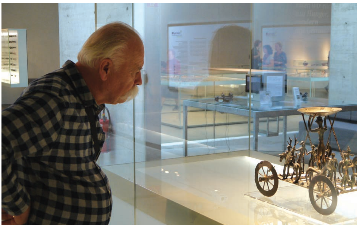
Múzeumi szakmai kiránduláson Grazban, 2018