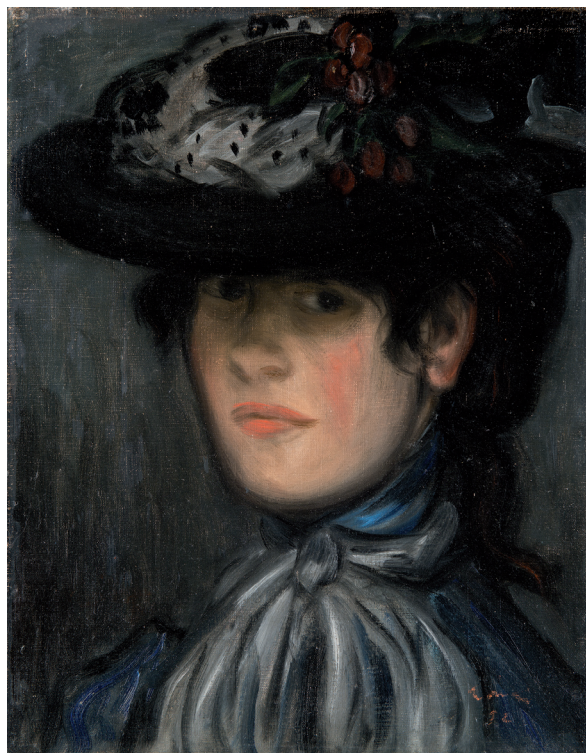
1. ábra. Rippl-Rónai József: Claudine Magyar Nemzeti Galéria tulajdona

Rippl-Rónai József halálának huszadik évfordulóján, 1947 decemberében a Nemzeti Szalon emlékkiállítás rendezett tiszteletére. A katalógusban méret és a tulajdonos nevének feltüntetése nélkül összesen 131 alkotást láthattak az érdeklődők. 28