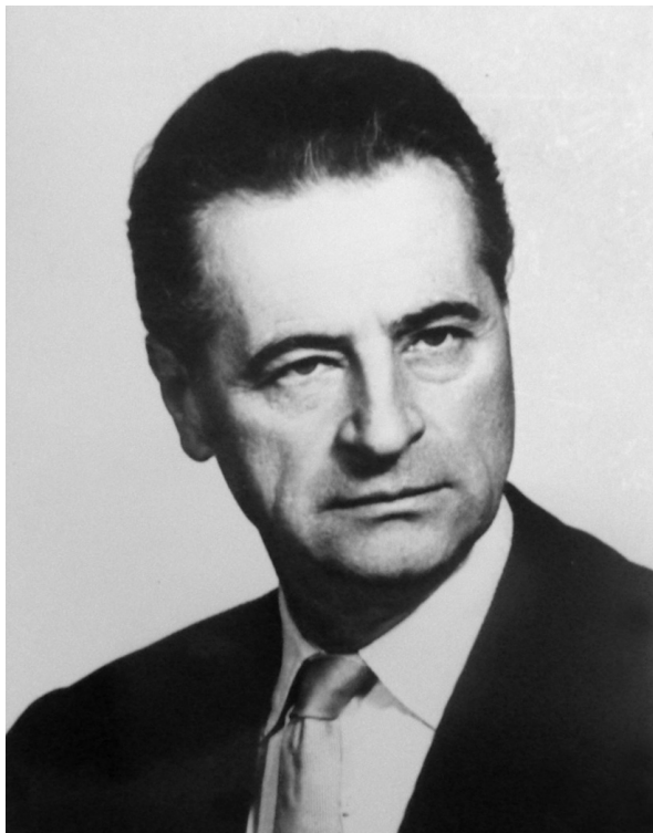
2. ábra. Völgyessy Ferenc arcképe. Magántulajdon.

A képet én 1918 karácsonyán kaptam a nevelő apámtól Rippl-Rónai Józseftől, Kaposváron, ahol én akkor éltem az ő háztartásukban, mint az ő nevelt lányuk. Vérégi kapcsolat is fűzött hozzájuk, mert Rippl-Rónai Józsefné az én édesanyámnak testvére, vagyis nekem nagynéném volt. Ez a kép a leánykori szobám falán lógott, a mosdó felett. Összesen két kép lógott ott abban a szobában a falon, úgy, hogy nem lehet róla tévedés, a másik kép az ágy mellett függött és az egy üvegre festett kis angyalfejet ábrázolt. A mosdó az ágy mellett volt, és a szoba az emeleten. Én 1919 évben mentem férjhez, és kezdetben még egy, vagy másfél évig Kaposváron éltünk. Azután elköltöztünk onnan 1921, vagy 1922 év őszén Budapestre. Budapestre költözésünkkor az a perbeli kép is, és a már említett angyalfejet ábrázoló másik kép is ott maradt Kaposváron, Rippl-Rónai Józsefénél. Nevelőapám Rippl-Rónai József 1927. november 25-én halt meg. Haláláig érintkezésben voltunk vele és halála után is az özvegygel. Özvegye maradt tovább ott ugyanabban a lakásban Kaposváron, de télen fel szokott járni hozzánk rendszeresen. A kép továbbra is ott maradt. Megemlítem, hogy 1927 októberében kiállítani akarta a mester a képet és akkor Budapesten volt az a kép. Akkor csináltattuk rája a jelenleg is rajta lévő brüsszeli ráját és pedig a férjem és én. De nem került kiállításra, mert elkésve ért be, és visszakerült a kép Kaposvárra. Úgy, hogy a mester halálakor a kép Kaposváron volt. A mester hagyatéká-