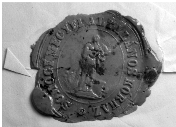
3. ábra. A kórház pecsétje, 1859–1860

A kutatás jelenlegi fázisában az valószínűsíthető, hogy 1859–60-ban keletkezett a kórház pecsétje (3. ábra), amelynek további használatára utaló dokumentumok nem maradtak ránk. A kialakításában különös igényességet és esztétikai szépséget hordozó pecsétnyomó az idők során eltűnt, lenyomata (sigillum) is csak egyetlen példányban tanulmányozható. A központi alak feloldása további feltáró munkát igényel. 99