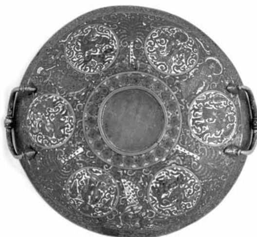
12. ábra. Az ún. Artukida tál hátoldala

mozgalmassága a korona szembenező alakjainak statikusságától idegen. A zománctechnikával díszített tál ábrázolásmódja mindenesetre utal a Bizánci birodalom és a környező királyságok közti kulturális hatásra. Hasonlóképpen a teljes díszítettségre törekedtek a Figdor gyűjtemény részét képező, aranyozott vörösréz ládika fedelén és oldalán, az indákkal és madarakkal sűrűn körülölelt 6 egész és 2 csonkított medalionba, György Ágota, Mária, Jézus, Keresztelő Szt. János, Simon, Júdás és Demeter mellképe került. Az alakok mozgalmasságát, mely a hajak ziláltságában is megnyilvánul, a ruharedők finomsága és változatossága is alátámasztja. A szentek nevének hibás, részben latin formái egy Bizáncon kívüli műhely létre utalnak. (13. ábra)