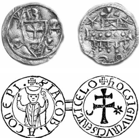
17. ábra. III. Béla dénárja 1189-1190 k. (CNH 263) és Jacques de Vitry pecsétje (1214-1225)

Nálunk II. András idejében jelenik meg ez az ábrázolásmód az uralkodói pecséteken (pl. második nagypecsétje 1216 előtt, aranybulla), ahol a király jobbján a nap, míg bal felől a hold és felette a csillag helyezkedett el. Ez az ábrázolásmód a szlavón báni dénár kettős keresztje mellett még a 13. század derekán is használatban volt. Meg kell azonban említeni ennek előzményét III. Béla 1189–90 közé datált, előlapján pajzsba foglalt kettős keresztrel ellátott dénárjában, ahol a hátlapon felül két csillag-, alul egy félholdábrázolás között talán egy stilizált koronát láthatjuk, kereszttel, függökkel.