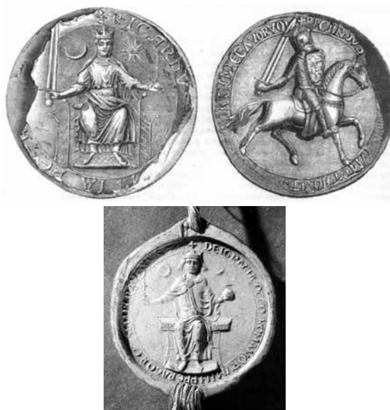
16. ábra. Oroszlánszívű Richárd (1189-99) és IV. Ottó császár pecsétje (1209) hold és csillagábrázolással

A nap és hold ábrázolás a kereszties államokhoz kapcsolódhat – amire a korábban felsorolt uralkodók kereszties hadjáratokban való aktív vagy passzív részvétele mellett alátámaszt az is, hogy Jacques de Vitry, Akkó püspöke ezt a szimbólumpárt, mind pecsétjén, mind mitráján, mind pedig hordozható oltárán megjelenítette. (17. ábra)