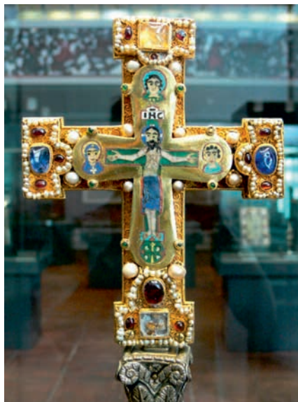
22. ábra. A Szt. Oswald korona trapéz alakú lemezei és a Welfi kereszt előlapja