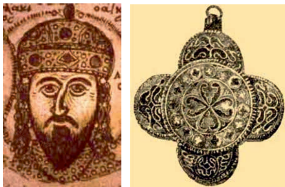
3. ábra. II. Izsák Angelosz kamelaukionnal a fején és enkolpion III. Béla sírjából

zad fordulóján, de végül a nyugati művészetben éri el csúcspontját, elég itt a Meuse-vidék fémművességére utalnunk. A vegyesen alkalmazott technológia ott sem volt ismeretlen. A 11–12. század fordulójától úgy tűnik, hogy divatba jött a korábbi zománccok újrafelhasználása, újabb zománccal való elegyítése, így nem egyszer a kétféle zománctechnika egyazon alkotáson jelenik meg. Ennek talán legismertebb példája a méretek és levágott zománcclemezek tanúsága szerint másodlagosan egybeszerkesztett Vercelli evangeliárium fedele. Hasonlóan másodlagosan elhelyezett elemekből készítették a Chiavennai könyvborítót, melyet feltehetően 1176-ban Cristiano de Magonza püspök ajándékozott a Chiavennai templom számára. Bár a bizánci művészetben még alapvetően a rekeszdíszítés dominál, de már megjelennek a keretezésnél, a díszítések elválasztásánál a szélesebb, alapba mélyített formák, először a császári, majd a helyi műhelyek munkáiban. A két részből álló, középen üreges homlokfüggőt két oldalt egy karikával a hajba fonták vagy a fejdíszhez rögzítették. A bizánci arisztokraták viseletét később a kijevi Rusz helyi műhelyeiben is utánozták és Kolty néven nagyon elterjedté vált. Sajátos módon, többet egybekapcsolva viselték, és a díszítésekben is megjelentek a helyi változatok, madarak, griffek, szentábrázolások. Némely darabon az eredeti gyöngykeretezés is megmaradt. 7 (1. ábra)