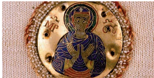
26. ábra. A Linköping mitra és a Brixeni kesztyű zománcai