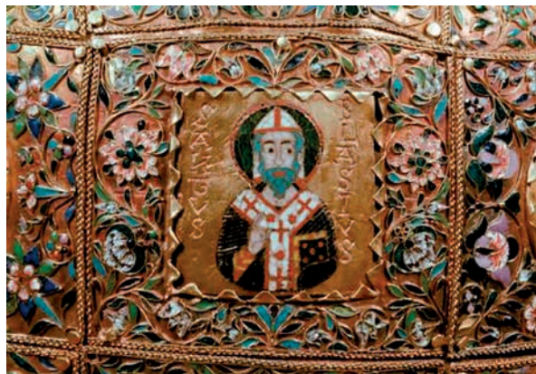
25. ábra. Szent Pál és Szent Balázs képmása a Dubrovnikai kar-, és fejereklyetartóról