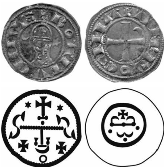
15. ábra. Antióchiai III. Bohemond (1163-1201) dénár és III. István érme (CNH 122.)

Nálunk II. András idejében jelenik meg ez az ábrázolásmód az uralkodói pecséteken (pl. második nagypecsétje 1216 előtt, aranybulla), ahol a király jobbján a nap, míg bal felől a hold és felette a csillag helyezkedett el. Ez az ábrázolásmód a szlavón báni dénár kettős keresztje mellett még a 13. század derekán is használatban volt. Meg kell azonban említeni ennek előzményét III. Béla 1189–90 közé datált, előlapján pajzsba foglalt kettős keresztrel ellátott dénárjában, ahol a hátlapon felül két csillag-, alul egy félholdábrázolás között talán egy stilizált koronát láthatjuk, kereszttel, függökkel.