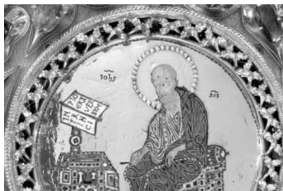
9. ábra. Pala d’Oro, Szt. Lőrinc és Szt. János felirat. 12. századi velencei munka

Ezek a rövidítések a Meuse/Maas-vidéki és német ötvöstárgyakon is előfordulnak. Feltűnő, hogy a betűket 1–1 tárgyon is többféle írásmóddal jelenítik meg, mintegy átmenetet képezve a maiuscula és a kurzív írásmódok között. Ugyan nem ötvöstárgy, de hasonló írásmódot találunk a pécsi székesegyház Szt. Bertalan apostolt ábrázoló relief feliratánál is. (11. ábra) Érdekes az ábrázolásmódban (szembeforduló alak, jobb