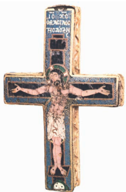
5. ábra. Ereklyetartó kereszt Thesszalonikiból

tása pedig az apostolok ívelt, kevésbé sűrű rekeszképzését idézi. (5. ábra) A kereszt ritkásabb rekeszeiben és színvilágában is párhuzamot jelent (ld. pirossal keretezett fehér keresztes zöld dicsfény). A kereszt – amelyet gyakran kötnek a Koppenhágában őrzött Dagmar kereszthez, illetve a Londonban őrzött Szt. György és Demeter ereklyetartóhoz, feltételez egy Thesszalonikiben működő műhelyet, amelynek 12–13. századi felvirágzása a Szentföld mohamedánna válásával egyre fontosabbá váló Szt. Demeter szentély központi szerepével magyarázható. 9