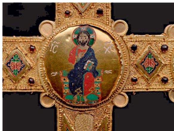
23. ábra. Az ún. Dagmar mellkereszt és a cosenzai ereklyetartó kereszt részlete