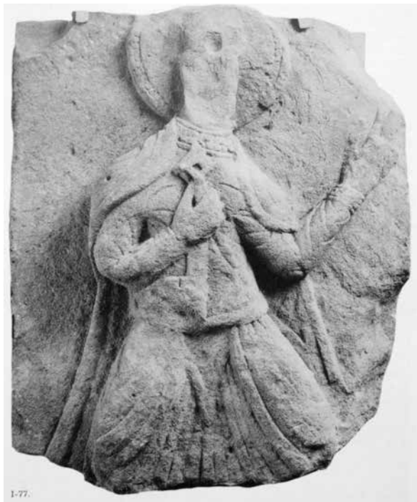
7. ábra. A somogyvári Szt. Péter relief

a könyvtábla felirata több ponton is párhuzamosságot mutat az apostollemez feliratával, pl. az A betű formai kialakításában, míg a ScS rövidítés mindkét emléktábla anyagában előfordul. 15 (10. ábra) A Pala d’Oro Szt. Lőrincet ábrázoló lemezén, Szt. János apostolt ábrázoló képhez hasonlóan a név előtt és után körbe foglalt négykaréjos díszítést találunk. Ugyancsak a koronán található névhez hasonló módon rövidítették János nevét a Pantokrátort övező evangélikusok ábrázolásánál. (9. ábra)