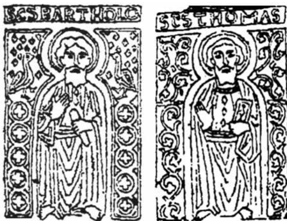
8. ábra. Szent Bertalan és Szent Tamás, Rauscher Lajos rajza

a könyvtábla felirata több ponton is párhuzamosságot mutat az apostollemez feliratával, pl. az A betű formai kialakításában, míg a ScS rövidítés mindkét emléktábla anyagában előfordul. 15 (10. ábra) A Pala d’Oro Szt. Lőrincet ábrázoló lemezén, Szt. János apostolt ábrázoló képhez hasonlóan a név előtt és után körbe foglalt négykaréjos díszítést találunk. Ugyancsak a koronán található névhez hasonló módon rövidítették János nevét a Pantokrátort övező evangélikusok ábrázolásánál. (9. ábra)