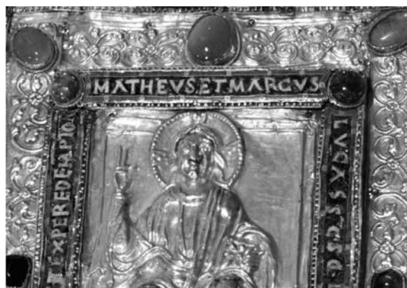
10. ábra. Sioni/Sitteni könyvtábla (1140-1150, Trier?)

Ezek a rövidítések a Meuse/Maas-vidéki és német ötvöstárgyakon is előfordulnak. Feltűnő, hogy a betűket 1–1 tárgyon is többféle írásmóddal jelenítik meg, mintegy átmenetet képezve a maiuscula és a kurzív írásmódok között. Ugyan nem ötvöstárgy, de hasonló írásmódot találunk a pécsi székesegyház Szt. Bertalan apostolt ábrázoló relief feliratánál is. (11. ábra) Érdekes az ábrázolásmódban (szembeforduló alak, jobb