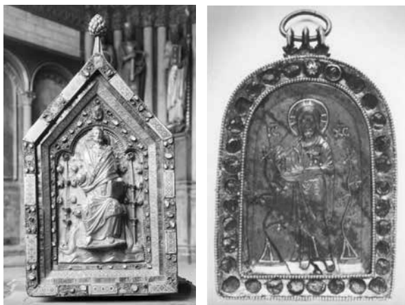
20. ábra. Szent Szerváciusz ereklyetartó (1160 k.) és 12. sz.-i kis ikon a Saint-Denis katedrális kincstárából