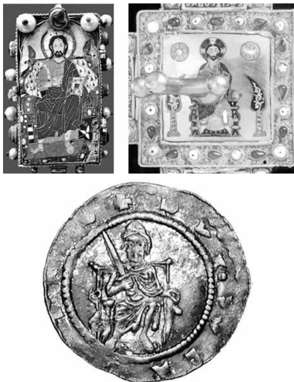
14. ábra. A Gelati és a corona latina Pantokrátora, valamint I. Ulászló pénzérme

A Nap és Hold megjelenítése a keresztre feszítés ábrázolása során, valamint megszemélyesített alakban a Maiestas ábrázolásoknál már a kora középkortól ismert, de csak a 12. század második felétől találunk párhuzamot erre az uralkodói pecséteken, pénzeken. Talán az első hold és csillagábrázolás III. Bohemond antióchiai uralkodó dénárján fordul elő, ahol az előlapi sisakos fejébrázolás két oldalán 1–1 holdat és csillagot jelenítettek meg. A hátlapi holdábrázolás sokkal inkább a sziglak körébe sorolható, és hasonlóképpen nem feltételezhetünk hasonló tudatosságot a III. István érme félhold és csillag ábrázolásánál sem. (15. ábra) Krisztus alakját övező két csillag ábrázolás Mánuel