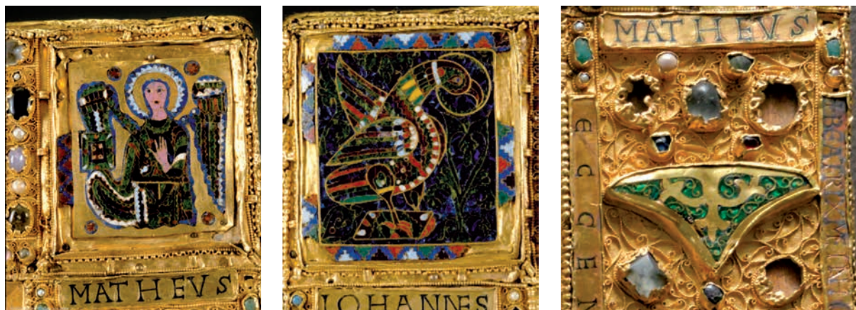
4. ábra. Máté és János evangélista és háromszög veret a Maastrichti könyvborítóról

Bár az apostollemezek teljes felülete díszített, nem egyforma módon tagoltak, van ahol a lemez keretén kívül csak a feliratot elválasztó sáv és az alak körvonala van kiemelve, míg Pál és Jakab esetében a felső, állatpárral történő díszítés hasonló módon, tagoló sávval válik el az oldalsó geometrikus díszítéstől. Szt. Péter esetében ezt az elválasztást egy egyszerű rekeszrel oldották meg, amelyen egyben a szárnyas állat (griff?) áll (ez a földet jelző vonal Jakab apostol esetében is megfigyelhető), míg a másik négy esetben ez is hiányzik.