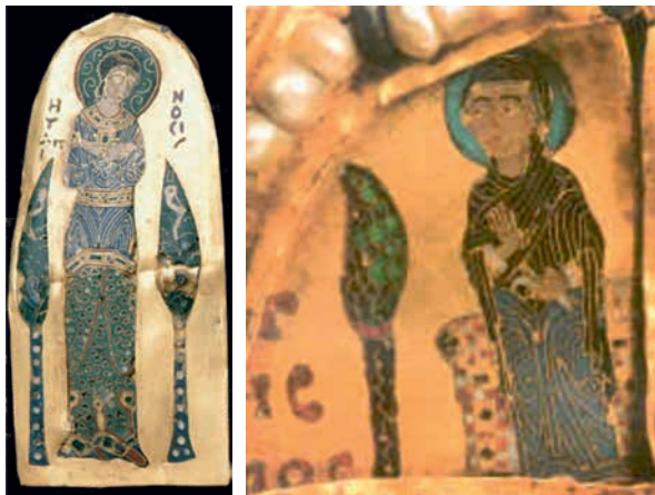
18. ábra. A Monomachos korona Alázat alakja és a Khalkuli triptichon