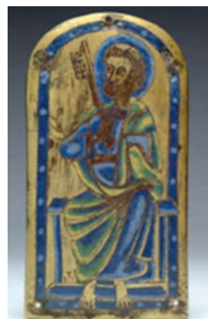
6. ábra. Szt. Péter alakja a koronáról, egy leoni ereklyetartó ládikáról és egy Maas-vidéki zománcveretről

Lajos a Szt. Bertalan lemezt Ipolyi 1886-ban megjelent könyvében. 13 (8. ábra) Nincs jogunk feltételezni, hogy ennél az apostolnál nem szerepeltették a szent előtagot. A betűk típusvizsgálatával Tóth Endre foglalkozott kimerítően, 14 így itt csak néhány további észrevételre hívnám fel a figyelmet. A betűkről általánosságban elmondható, hogy nem túlzottan konzekvens az alkalmazásuk, elég csak a többféle A, T és V betűre gondolnunk. Ugyancsak különlegesség János nevében szereplő kurzív h betű alkalmazása. Eddig talán kevésbé volt tárgyalva a ScS rövidítés, ahol a középső C fölött szerepel a ligatúra.