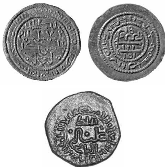
28. ábra. III. Béla rézpénze és II. Vilmos (1166-1189) follisa 57

III. Béla Esztergomban, ahol a király ötvösműhelyt is működtetett, 58 nagyszabású építkezésekbe kezdett, ahol a díszítések részben bizánci gyökerekből táplálkoztak (pl. kápolna freskó). Feltehetően az ötvösműhelyben is dolgoztak bizánci gyökerű mesterek. Bizonyosak lehetünk afelől, hogy III. Béla neveltetése mellett a Szerémség és Délvidék 16 évig tartó bizánci fennhatósága is hozzájárult a bizánci művészet magyarországi elterjedéséhez. Úgy tűnik, hogy a 13. század elején a Bizánctól korábban megszerzett zománcokat – köztük III. Béla enkolpionjához (3. ábra) hasonló lunetta alakú lemezeket - másodlagosan is feldolgozták, elég itt a cseh Vyssi Brodban őrzött kettős kereszt alakú szturothékára gondolnunk. 59