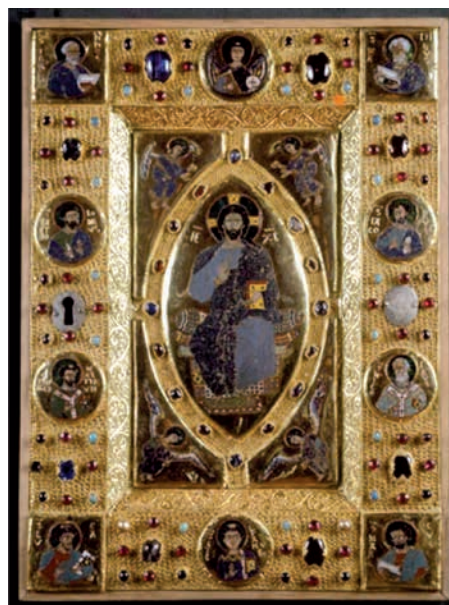
24. ábra. A capuai könyvborító Pantokrátor ábrázolása