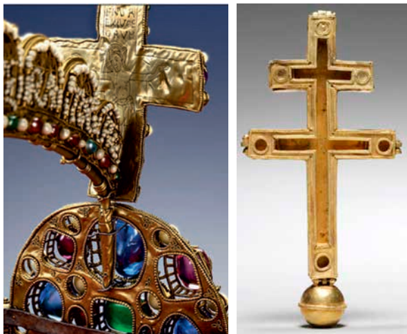
21. ábra. Kereszt a német-római császári koronáról és ereklyetartó kereszt a jeruzsálemi királyságból (12. sz.)

szítés hosszú időszakon keresztül való alkalmazása, némely apró részlet megfigyelése talán segíthet annak datálásában. A felezett szív alakú filigrán felső vége szinte teljesen kör alakban visszahajlik, míg belsejében egy vele ellentétes tájolású kisebb felezett szív alakú filigrán található alul visszahajló körrel, illetve a kettő között elhelyezkedő oldalággal. A nagyobbik filigránból felfelé egy vele ellentétes ívű, visszahajló ágacska nyúlik ki. Ez a motívum mind függőlegesen, mind vízszintesen tükrözött, ezek közé helyezték el felváltva a drágakő berakásokat. 28 Egy másik különlegessége, hogy a drótok nem folyamatosak, minden hajlított darabot egyenként forrasztották fel az alaplemezre. A filigrán kiképzésére talán legközelebbi párhuzam a székesfehérvári királysírokban talált lemezekén, a gyermek III. László sírjából (+1205) előkerült aranyleleteken és a jogar fején fordul elő. 29 A drágakövek elrendezése egyértelműen utal az Árpádház címerére, amelynek címerként való használata először Imre uralkodása alatt (1202-től) jelenik meg. Úgy tűnik, hogy a filigrános keret megalkotóját mindenképp a III. Béla idejében már működő ötvösműhely egyik aranyműveséhez kell kötnünk. Kovács Éva szerint a párhuzamként adódó Szt. Oswald fejereklyetartó koronájának trapéz alakú lemezei a 12. század második felében a magyar királyi udvar ajándékként került a Welfek birtokába, amit a fehér gyöngy és piros gránát keret is alátámasztani látszik. 30 A Welf kincsek részét képező, a 12. század