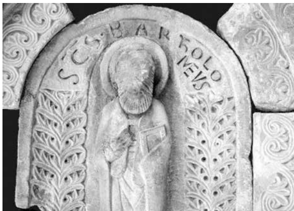
11. ábra. Apostolábrázolás a pécsi székesegyházból, 12. sz. második fele

keze mellén, baljában könyvvel, két oldalán növényi díszítéssel) és a ruha V alakú redőzésében rejlő hasonlóságokat is figyelembe venni. 16