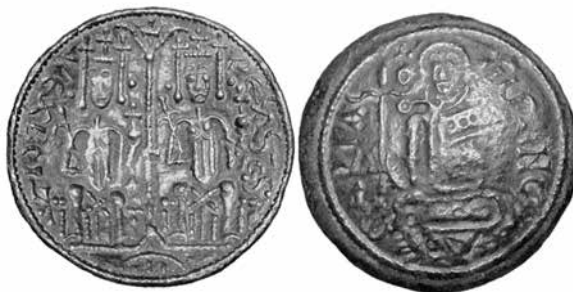
27. ábra. III. Béla réz pénzérme (CNH 98)

A bizánci művészet hatása Magyarországra a 12. században számtalan forrásból táplálkozhatott. Nem lehet figyelmen kívül hagyni a nem direkt bizánci művészeti impulzus hazai leképezését sem, itt elsősorban Antióchia, Szicília és Velence játszhatott szerepet. Az Antióchiából érkező hatás Antióchiai Ágnes (magyar nevén Anna), a bizánci császárné, Mária féltestvére, III. Béla felesége révén érkezhettek. Mivel felsorolással nem rendelkezünk, hogy valós tárgyakat köthessünk a házasságkötéshez, csak áttételes módon igazolható ez a kapcsolat. 50