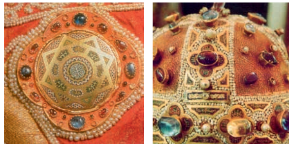
2. ábra. Zománcdíszítés II. Roger király palástjáról és részlet Konstancia koronájáról

Az apostolokat ábrázoló lemezek átmenetet képvisnek az ún. cloisonné és a későbbi champlevé zománctechnikák között, vagyis a 10. századtól Bizáncban elterjedt technika mellett – mikor az arany alapba kalapált díszítést töltötték ki másodlagosan vékony drótból hajlított rekeszekkel – a 11. század végétől fokozatosan tért hódít az a megoldás, mikor a későbbi zománccal díszítendő részeket az alapba vésik, ami a rekeszek szerepét váltja ki. Így az arany alap egyes részletei a felszínen is láthatóak. Az így kialakított sávok, körök közeit általában az aranylemezre ráapplikált rekeszek díszítették. A korábbi nagyobb arany háttérrel párhuzamosan beszűkül, geometrizálódott. Ez a technikai újítás Bizáncban fejlődött ki a 11–12. szá-