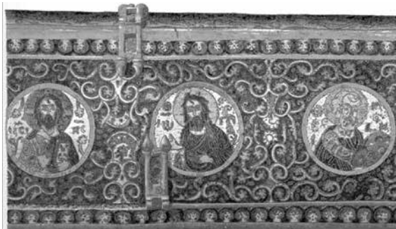
13. ábra. Láda a Figdor gyűjteményből

Hasonlóképpen a teljes felület díszítésére törekedtek a már Deér által is az apostollemezék párhuzamként megjelölt Herakleiai S. Theodore ábrázoláson. Ennek az új stílusnak talán legkifejlettebb formáját a Velencében őrzött, részleteiben plasztikusan kiképzett, a 12–13. század fordulójára keltezhető Szt. Mihály ábrázolás jelenti. Ennek, már a velencei zománcművészeire jellemző, kis drágakő vagy üveggerakásokkal díszített külső keretezése, Bizánc keresztetek általi kirablását követő időben készült.