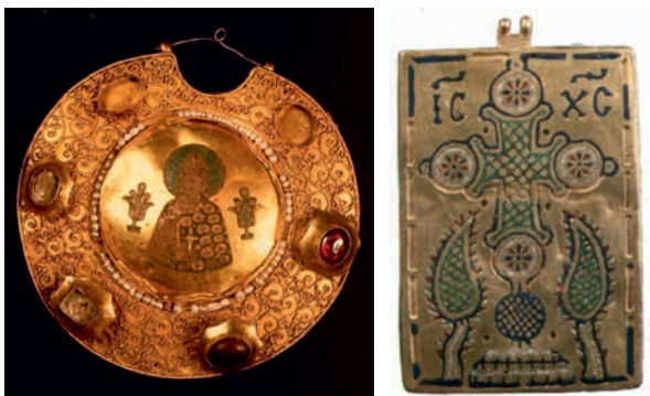
19. ábra. Növénytárral övezett szent alakja Rjazanyból és bizánci ereklyetartó hátoldala cipruspárral egy 12. századi sírból

királyság közvetítésének köszönhető, hiszen a Palermói Cappella Palatina mozaikjain már a 12. század közepén megjelennek, aminek hatása mind a velencei (Szt. Márk székesegyház kupola), mind pedig a római (S. Paolo fuori le Mura apszis) művészet felé kisugárzott.